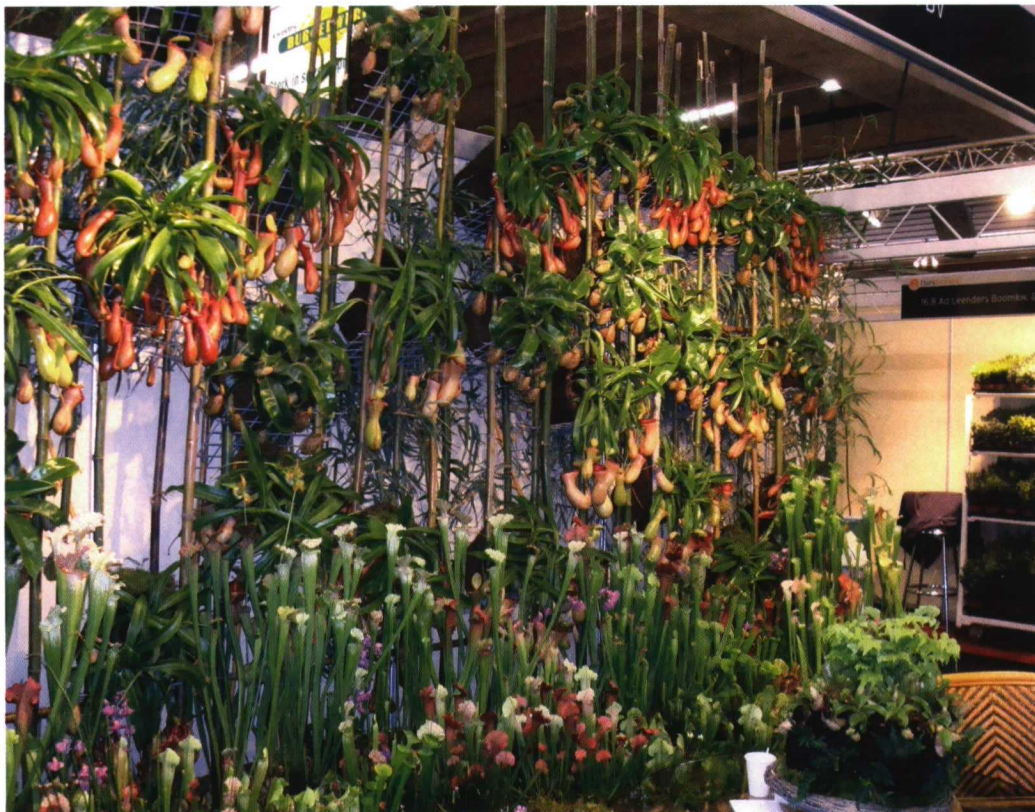
En este caso, la diversidad se aplica a las plantas carnívoras; el cultivador es Carni Flora, de Aalsmeer.

la variedad Fleurie salió a la venta a principios de diciembre pasado. La serie tiene un crecimiento compacto, florece rápidamente con 5 o 6 flores a la vez y seguirá floreciendo mientras la temperatura diurna esté entre 10 y 15°C. Gracias a la reproducción mediante cultivo de tejidos, las Garvineas se pueden cultivar de manera uniforme. La duración del cultivo en invernadero es de 10 a 12 semanas, incluido el período de endurecimiento. Información pensada para Holanda indica que debido a la reducida necesidad de calor, “relativamente hablando”, las plantas se pueden cultivar sin consumir mucha energía.