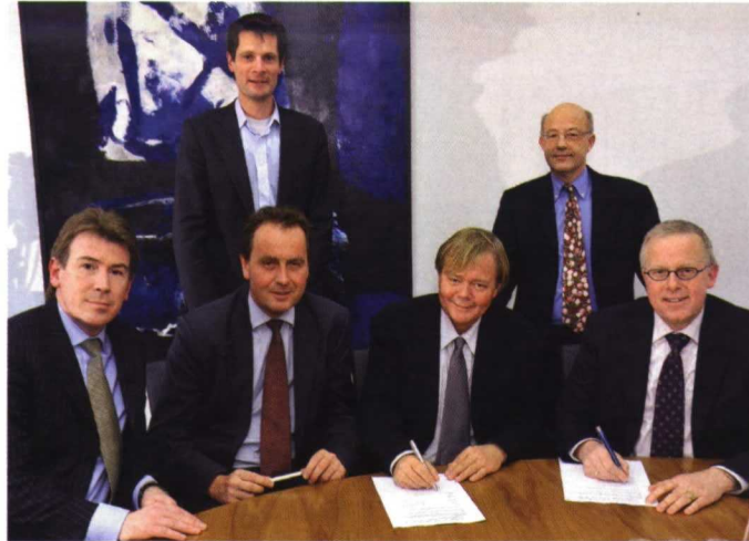
La imagen de la firma del documento de integración de todas las actividades de televenta de flores TFA en FloraHolland.

Estudios actuales a nivel de consumidor indican que