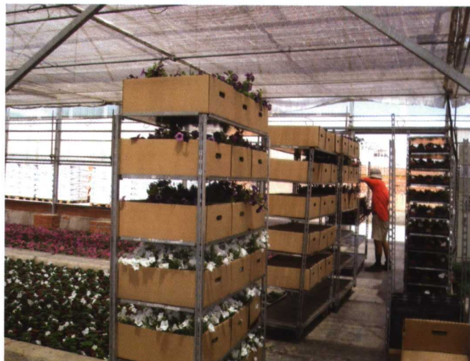
En las fotos superiores, invernadero con plantas seleccionadas para su multiplicación en los trabajos de biotecnología. En la otra imagen, la preparación de un pedido en el interior del invernadero.

La Veguilla se especializa. Los inicios fueron en planta terminada de flor. “En el comercio de plantas de semilla, empieza la robotización y fue entonces cuando decidimos producir planta de esqueje”. La idea de tener material vegetal propio viene después, para intercambiar y comercializar con otras empresas.