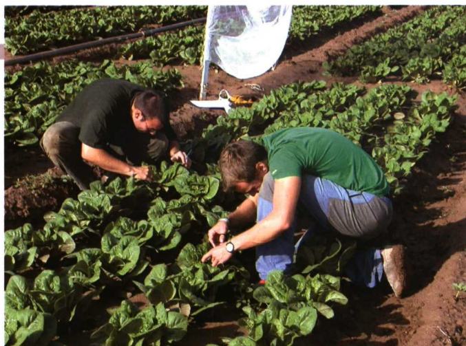
Muestreo semanal de plantas.

La conservación del control biológico integra la manipulación del medio para aumentar la supervivencia, fecundidad, longevidad, facilitar el establecimiento y mejorar el comportamiento de los enemigos naturales para incrementar su efectividad (LANDIS et al., 2000). Para ello, el primer paso es conocer las especies autóctonas de enemigos natura-