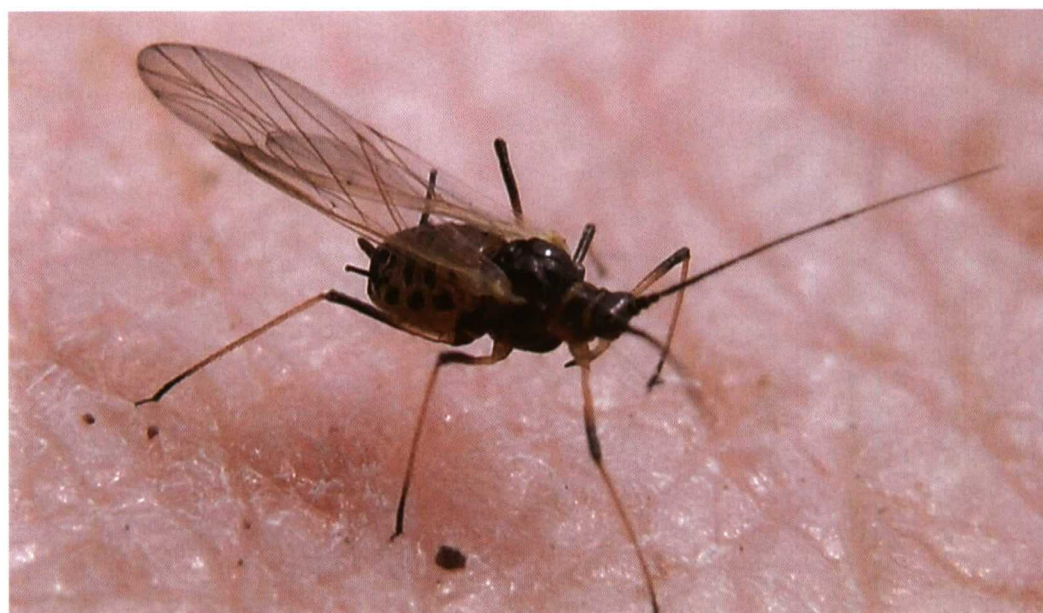
Detalle de Nasonovia ribisnigri alado.

El cultivo de lechuga ( Lactuca sativa L.) tiene una gran importancia en la agricultura española. En la actualidad están