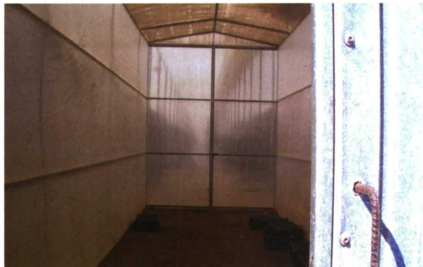
Doble puerta de entrada, tipo antesala.

Tomando como base los principios indicados, se han ido redactando, publicando oficialmente e implantando Normas Específicas de Producción Integrada para diversos cultivos y en diferentes Comunidades Autónomas. En la medida que se ha visto la necesidad y de acuerdo con los medios disponibles, se han ido