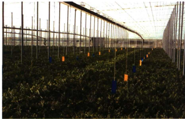
Vista de un cultivo controlado con placas adhesivas.

Para definir, manejar y aplicar adecuadamente el concepto de Producción Integrada se ha tenido como base lo establecido por la OILB. Así, podemos definirla