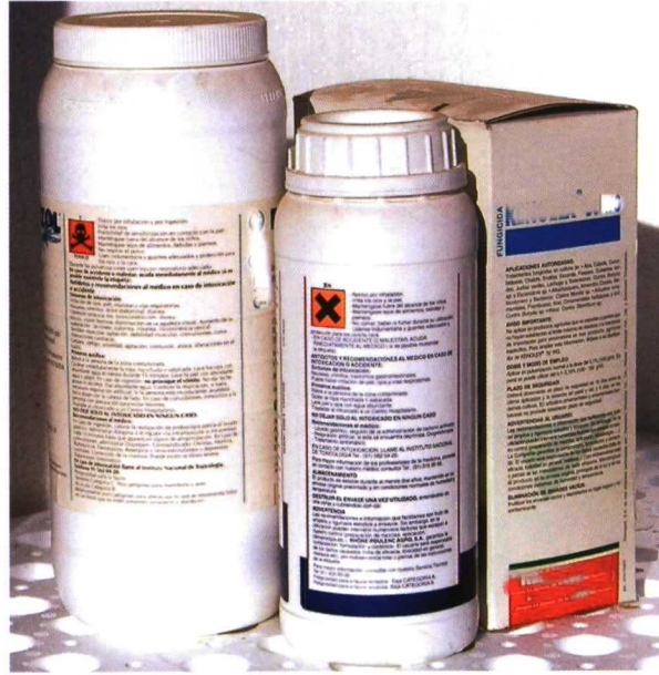
En la foto superior izquierda se aprecia una larva de Bemisia parasitada. A la derecha envases fitosanitarios con etiquetas para su correcta utilización.

- Sólo se utilizarán los productos formulados con sustancias activas recogidas en los Reglamentos Específicos, que serán los específicamente autorizados para el cultivo y la plaga con los condicionamientos que se indiquen en los métodos de control que figuran en cada Reglamento.