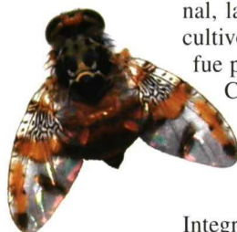
Hembra de la mosca de la fruta, Ceratitis capitata .