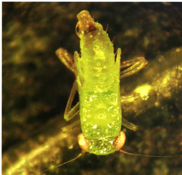
Ninfa de mosquito verde, Empoasca decipiens , en hoja de cítrico.

Como puede verse, en conjunto, la Producción Integrada en cítricos presenta una serie de problemas o inconvenientes para su óptimo desarrollo, comparándola con una Producción Convencional. Requiere una buena formación de técnicos y agricultores, capaces de desarrollar adecuadamente este