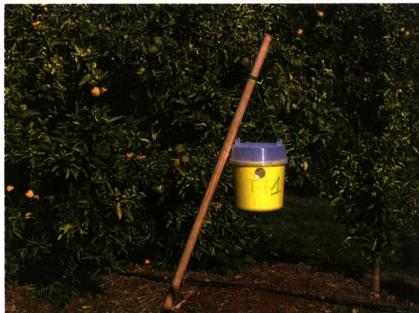
Trampa Tephri-Trap, con cebo alimenticio para captura de machos y hembras de C. capitata en campo.

En la Comunidad Valenciana fue clave para el desarrollo de la Producción Integrada en cítricos, la publicación del decreto 121/1995 (DOGV, 04.07.1995) sobre valoración de productos agrarios obtenidos por técnicas de agricultura integrada, y de la orden sobre reglamentación de las producciones obtenidas por técnicas de agricultura integrada y de las condiciones de autorización de