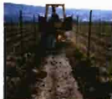
Riego por goteo BAJO SUPERFICIE GEODRIP: Tecnología ROOTGUARD