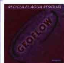
GEOFLOW: Reutilización de EFLUENTES URBANOS