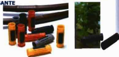
IDL GOTERÓ TURBULENTO