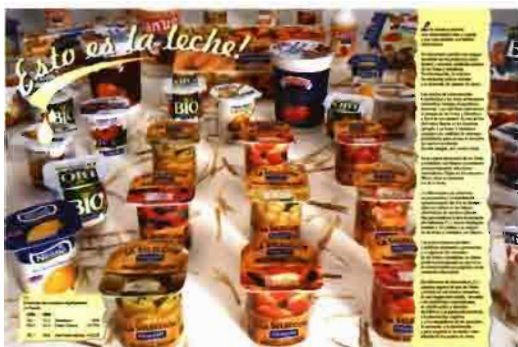
«¡Esto es la leche!» Guía Frutas-Hortalizas - marzo 1998 Rev. HORTICULTURA EXTRA - feb. 1998