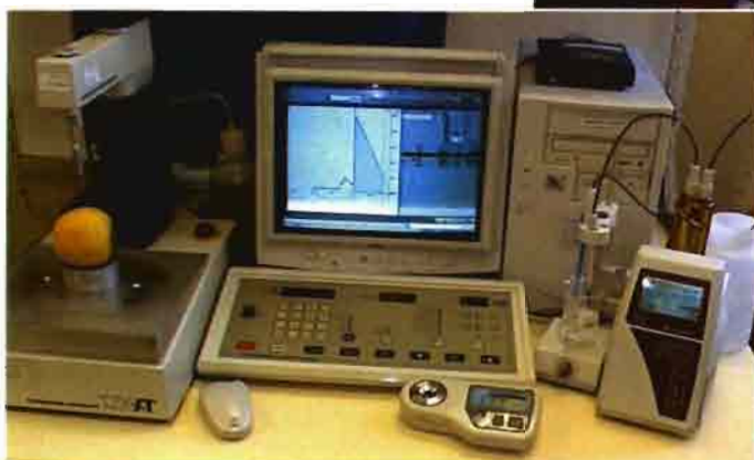
Arriba, centro de control de calidad; a la derecha, el resultado final: producto seleccionado y envasado en el punto de venta.