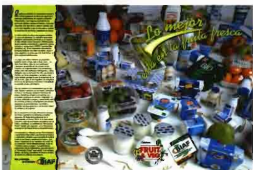
«Lo mejor está en la fruta fresca» Guía Frutas-Hortalizas - febrero 1999 Rev. HORTICULTURA - junio 1999

Es una publicación en dónde autores de todo el mundo relacionan y argumentan las propiedades saludables y nutritivas de las FRUTAS y HORTALIZAS . Próximamente la promoción utilizará estos contenidos para comunicarse con sus clientes e incentivar el consumo. Libro patrocinado por marcas de FRUTAS y HORTALIZAS .