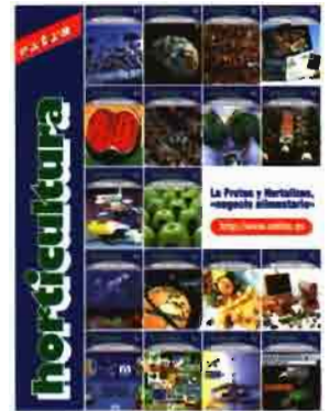
Revista HORTICULTURA, desde enero 1982