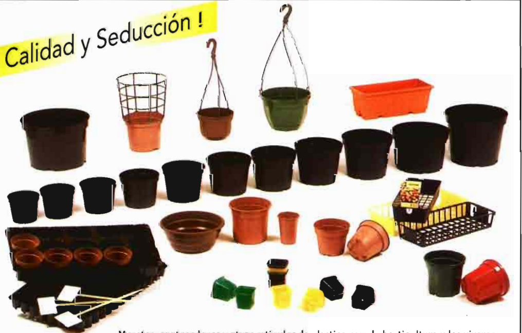
Macetas, contenedores y otros artículos de plástico para la horticultura y los viveros