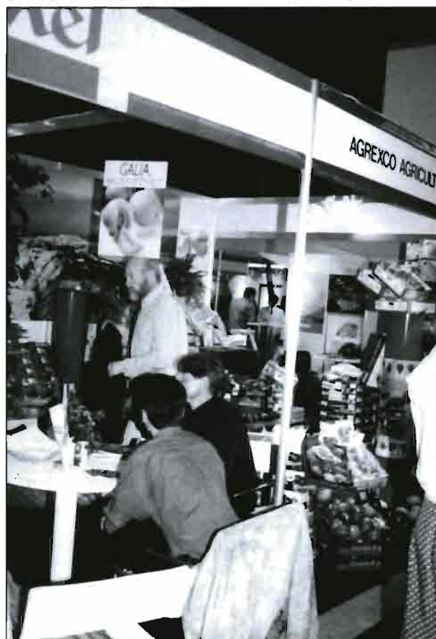
Foto inferior: Una imagen del certamen AGF Totaal de Rotterdam. La oficina de Holanda de Agrexco, expuso los productos que Israel hace llegar a los mercados europeos.

Foto superior: Las frutas y hortalizas y las legumbres constituyen uno de los pilares de la llamada dieta mediterránea. Los altos contenidos de vitaminas, el importante aporte de fibras y la gran diversidad de minerales, hacen que su consumo diario sea, más que recomendable necesario.