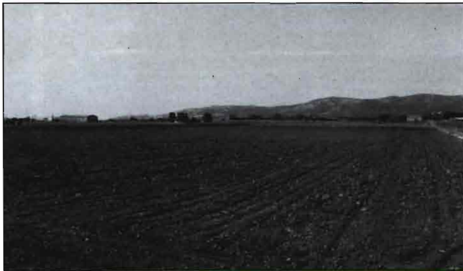
Este es el aspecto que presentan grandes extensiones de terreno este año durante los meses de verano en la comarca del Baix Maestrat. Hace tres años, aquí, se cultivaban grandes extensiones de tomates.

Hablando con cifras concretas en la producción de lechugas, tomates y pimientos, en 1989 se recogieron 7.896.028 Kg., 2.106.986 Kg. y 801.806 Kg. respectivamente: en 1990, 5.841.995 Kg., 1.759.272 Kg. y 730.207 Kg. igualmente y en 1991 ya se pasó a 4.659.070 Kg., 541.596 Kg. y 207.524 Kg. Cabe decir que se trata de cifras anuales, dado que si nos referimos a las producidas en verano las cantidades son insignificantes por decir algo y las habidas corresponden a cultivos bajo inverna-