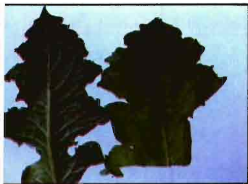
Hojas de gerbera mostrando ataque de P. Latus , (Foto J. Rodríguez).