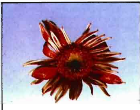
Inflorescencias de gerbera con flores liguladas decoloradas y deformadas por el ataque de P. Latus , (Foto J. Rodríguez).

Las inflorescencias afectadas se deforman y decoloran. Sobre las ligulas de las flores externas del capítulo es visible la pérdida de color, más patente en las variedades de tintes más oscuros (fig. 6), o la aparición de tonos marrón claro en las variedades de colores claros. En todos los casos las ligulas se recurvan hacia el haz (fig. 7), llegando -en ocasiones- a distorsionarse sobre el eje longitudinal. En casos de fuertes ataques el desarrollo de todas las flores del capí-