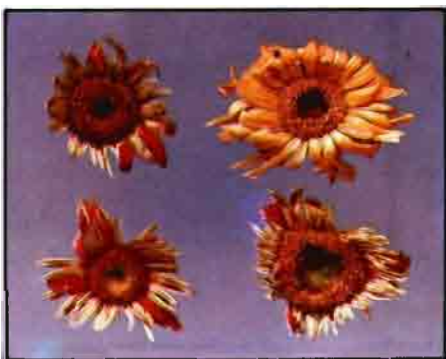
Inflorescencias de gerbera que muestran el ataque de P. Latus , (Foto J. Rodríguez).

En la planta, las hojas se presentan -en los dos casos anteriormente apuntados- más o menos deformados, con arrugamientos internerviales (fig. 2); plegadas generalmente hacia el haz -a veces hacia el envés- (fig. 3), dependiendo del lugar donde se localicen inicialmente las poblaciones del ácaro. Las hojas jóvenes, en formación, pueden aparecer con el limbo semihendido en la parte apical (fig. 4) con el borde marcadamente recurvado hacia el haz (fig. 5). Al mismo tiempo, estas hojas, presentan una coloración marrón-verdosa, plateada, y una consistencia quebradiza, cuando se les presiona con la mano.