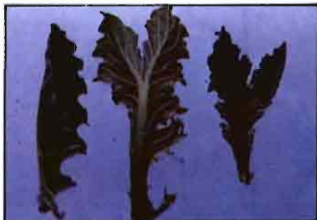
Hojas jóvenes de gerbera que presentan limbo hendido y coloración marrón-verdosa-plateada, (Foto J. Rodríguez).

la comarca, hace pensar que esta plaga pueda adquirir importantes dimensiones cualitativas y cuantitativas; como ocurre en algunas regiones italianas (Nucifora, 1961 y 1980).