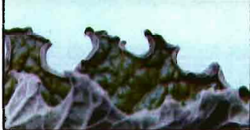
Borde del limbo de la hoja de gerbera curvado hacia el haz.