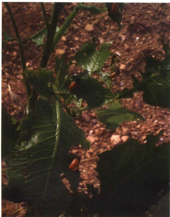
..... Adultos de Clytra devorando hojas de un árbol joven de pistachero (Kerman)