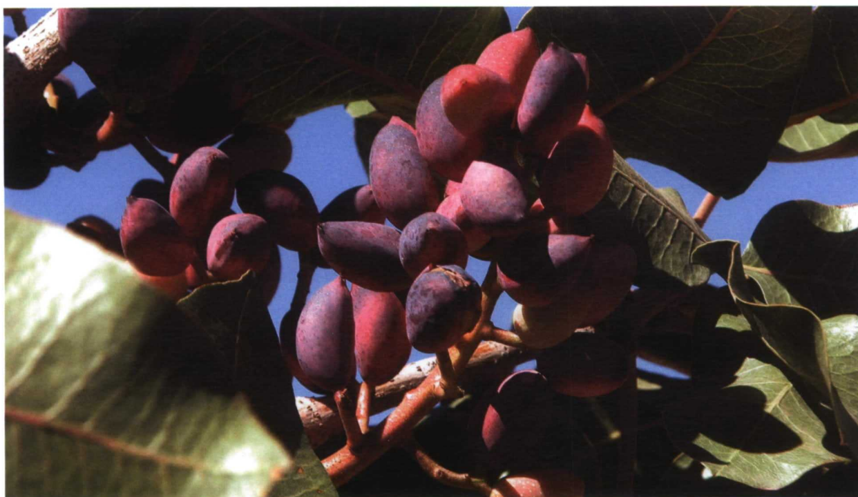
Frutos de la variedad Lárnaca

A partir del quinto o sexto año del injerto y una vez cada cinco años, se pueden incorporar entre 20 y 30 toneladas por hectárea de estiércol ecológico de ganado vacuno u ovino.