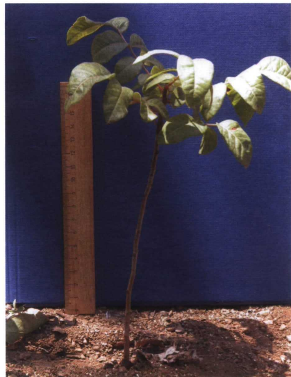
Cornicabra de un crecimiento (una savia)

Al principio de la primavera eliminaremos los brotes laterales en los primeros 20-40cm. Inicialmente no se ne-