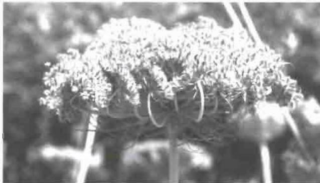
Umbela de zanahoria

En las plantas bianuales podemos sembrar semilla, guardar la raíz y esperar a tener de nuevo semillas. Es el método