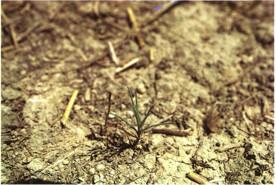
Plántula de Salsola