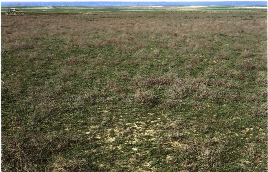
Rastrojo de cereal con plantas secas