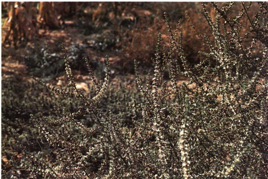
Detalle de las ramas