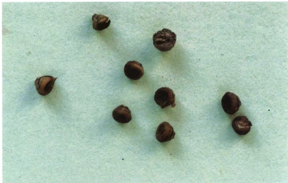
Semillas de Salsola (1-2,5mm.)