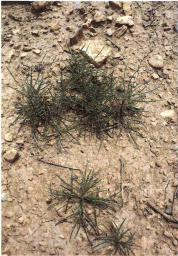
Salsola en crecimiento