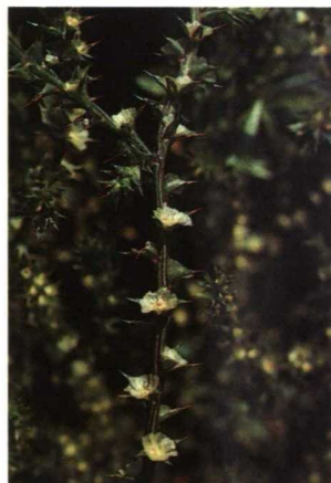
Detalle de las flores

Le gusta crecer en suelos libres de otras plantas, ya que es muy sensible a la competencia. También lo es a la siega. Comienza a aparecer cuando los cereales han terminado su ciclo vegetativo y normalmente se escapa a los herbicidas hormonales porque nace después de realizado el tratamiento habitual, a fines del ahijado. Después de la cosecha se extiende por los rastrojos y también en los barbechos, a los que priva de su capacidad de almacenamiento de agua ya que la extrae, con su raíz pivotante, desde gran profundidad. Ello obliga a continuos pases de cultivador. Desde estas zonas invade los campos vecinos, rodando en invier-