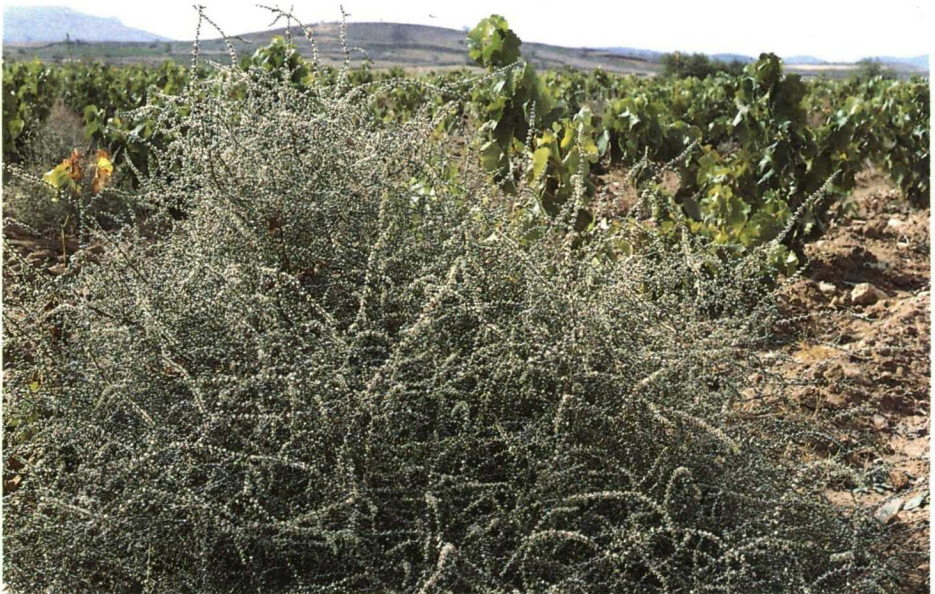
Salsola en floración