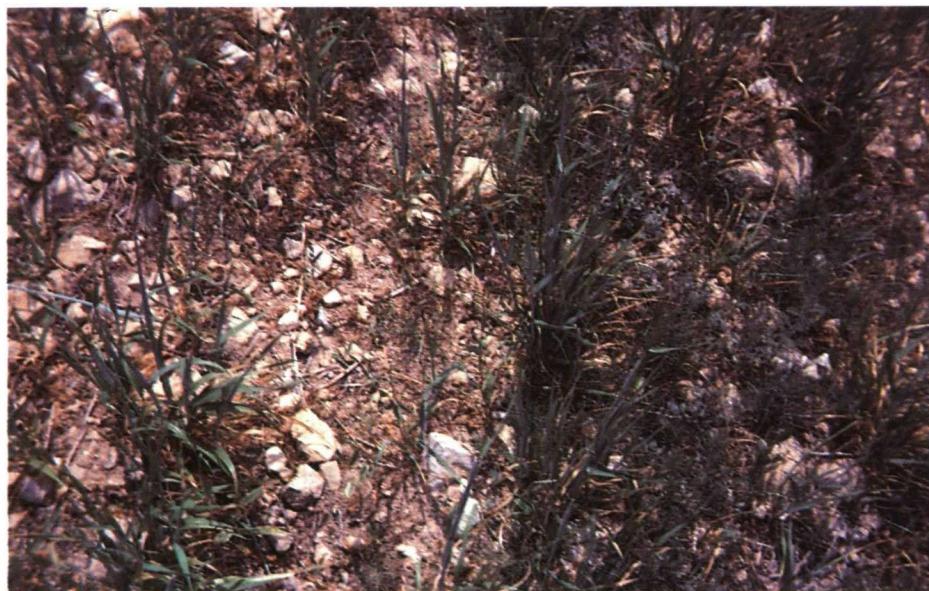
Detalle de una parcela tratada con herbicida junto a un testigo sin tratamiento