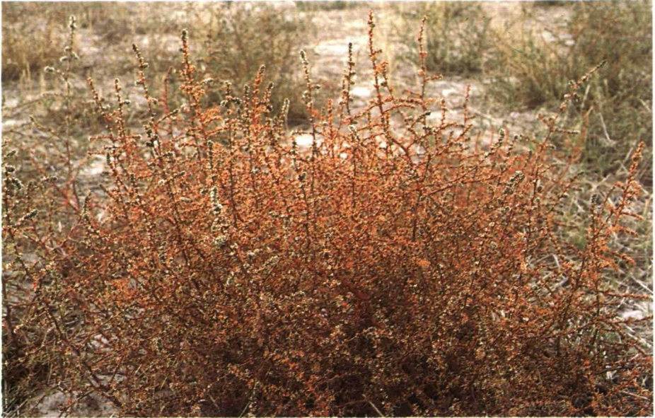
Planta fructificando. Cambia de color con el frío