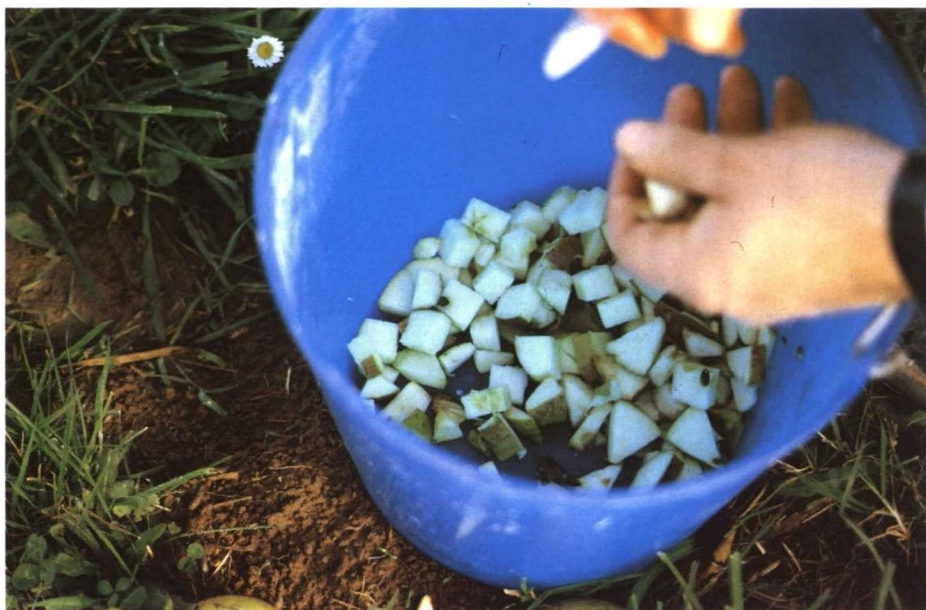
Preparación de cebos de manzana.

Para que la lucha sea eficaz debe seguirse los siguientes consejos: