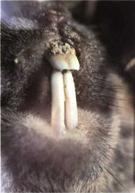
Detalle de la boca.

Los rasgos más característicos son el tener cola corta, entre 50-70 mm., hocico corto y orejas muy pequeñas, con peso comprendido entre 90-180 grs.