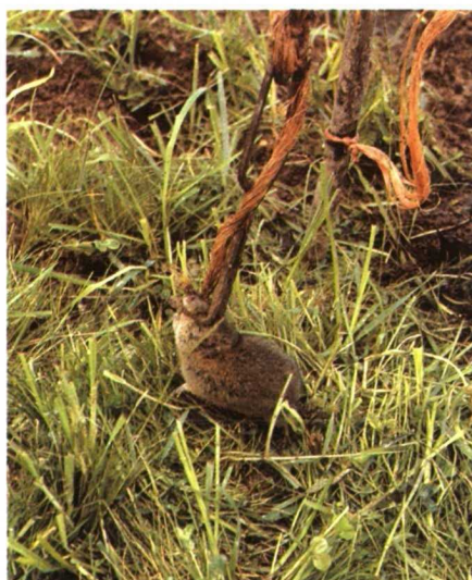
Captura por medio de pinza.