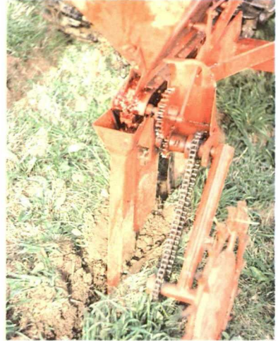
Detalle de arado-topo.

El manejo de los productos anticoagulantes en concentrados oleosos debe efectuarse con guantes. Una vez preparado el cebo, se destapan las «toperas» más recientes y se colocan de 4 a 5 trozos, tras lo cual se deja destapada.