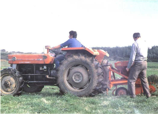
Aplicación de cebos por medio de arado-topo.