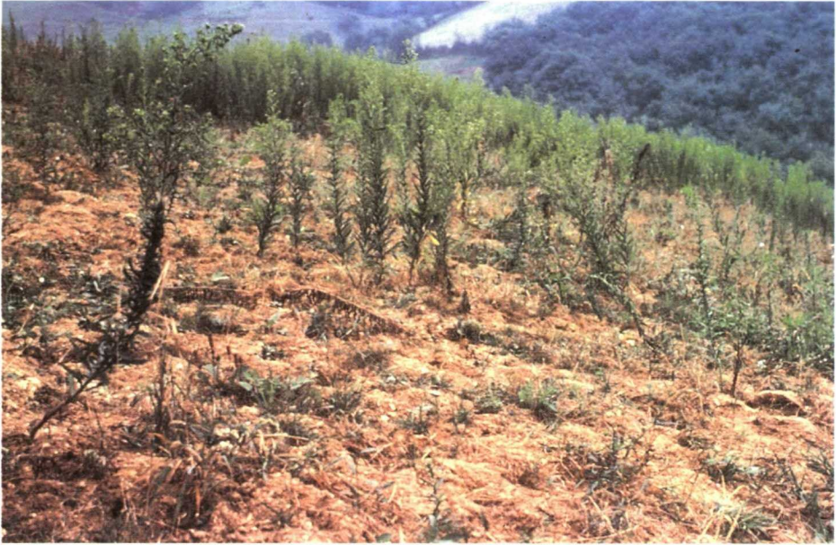
Daños en pradera.