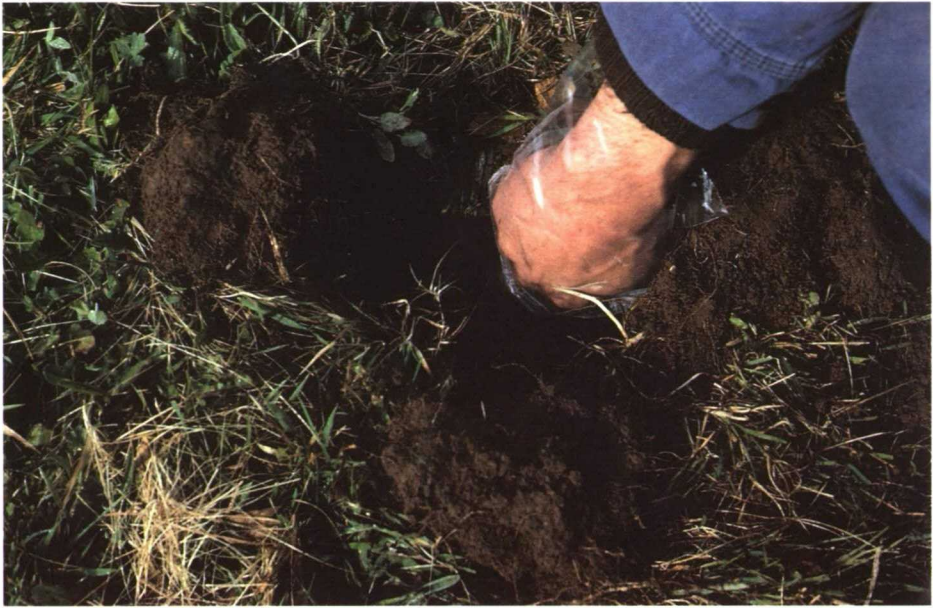
Aplicación manual de cebos.

El presente folleto ha sido realizado por el Grupo de Trabajo de vertebrados perjudiciales, del que forman parte técnicos de la Subdirección General de Sanidad Vegetal, de los Servicios de Protección de los Vegetales y Sanidad Vegetal de las Comunidades Autónomas, de Investigaciones Agrarias y Escuelas Técnicas de Ingenieros Agrónomos.