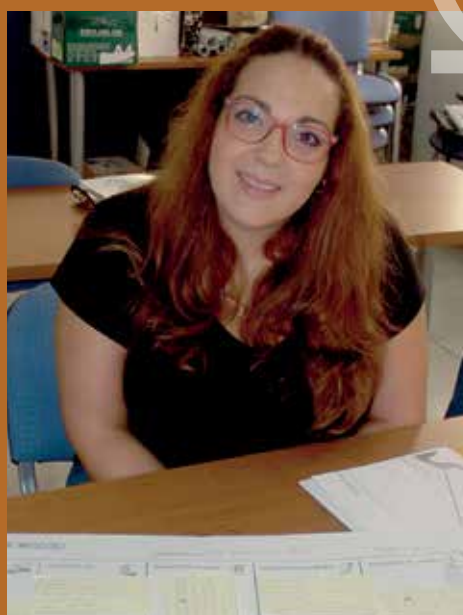
Una de las participantes en una sesión WBM de Andanatura.

WBM es un proyecto cofinanciado en un 90% por el Instituto de la Mujer y para la Igualdad de Oportunidades a través de las EEA Grants y el Mecanismo Financiero del Espacio Económico Europeo en el marco del Memorándum de Acuerdo suscrito entre el Reino de Noruega, Islandia, el Principado de Liechtenstein y el Reino de España.