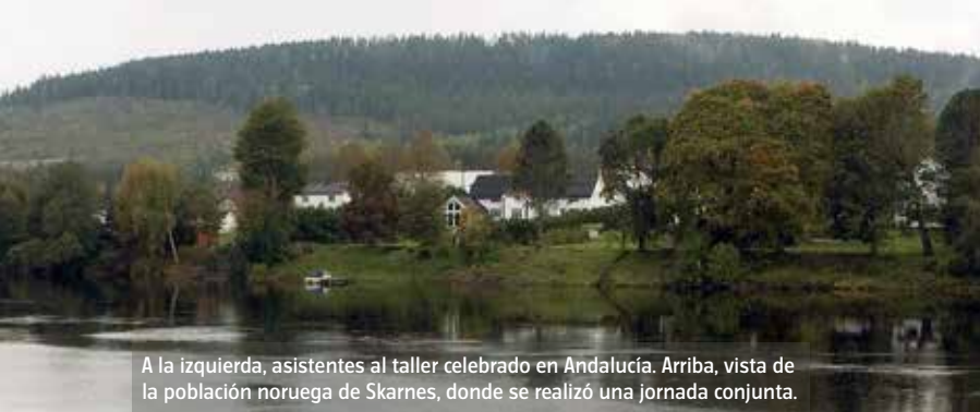
A la izquierda, asistentes al taller celebrado en Andalucía. Arriba, vista de la población noruega de Skarnes, donde se realizó una jornada conjunta.

de mejora mediante la innovación, como en modelos de negocio menos tradicionales (había animadoras infantiles, una wedding planner , joyeras, blogueras de moda, psicólogas...).