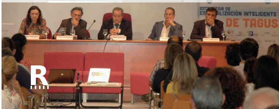
En la página anterior, mapa de municipios miembros de Tagus y figura del proceso de innovación social. Bajo estas líneas, presentación oficial de la estrategia.

La consecuencia de la puesta en marcha de la estrategia de especialización inteligente es la creación de un nuevo modelo de desarrollo de carácter abierto y masivo para todas las personas del territorio, caracterizado por un itinerario de servicios que van desde el apoyo a las personas para que diseñen sus propias ideas empresariales y emprendedoras de especialización inteligente, hasta la financiación y materialización de las mismas. R