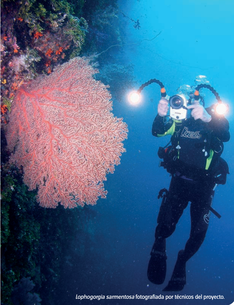
Lophogorgia sarmentosa fotografiada por técnicos del proyecto.

En 2013 la Comunidad Valenciana recibió cerca de seis millones de turistas internacionales y un total de 16,8 millones de visitas de residentes, según fuentes del Instituto de Turismo de España ( Turespaña ). El litoral alicantino constituye un fuerte reclamo turístico a nivel nacional e internacional, y soporta gran cantidad de visitas durante prácticamente todo el año. Las cifras del Instituto Nacional de Estadística (INE) de 2013 posicionan a la provincia de Alicante y la Costa Blanca como la de mayor oferta turística en establecimientos dentro de la comunidad: 483 en Alicante, frente a 388 y 236 de Valencia y Castellón respectivamente.