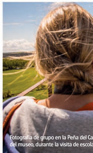
Fotografía de grupo en la Peña del Castillo del museo, durante la visita de escuela.