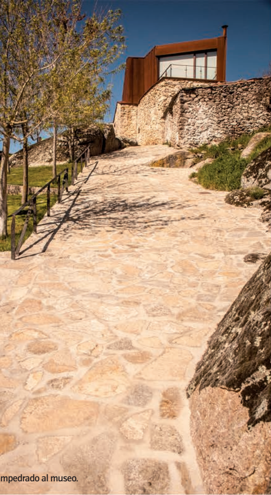
Empedrado al museo.