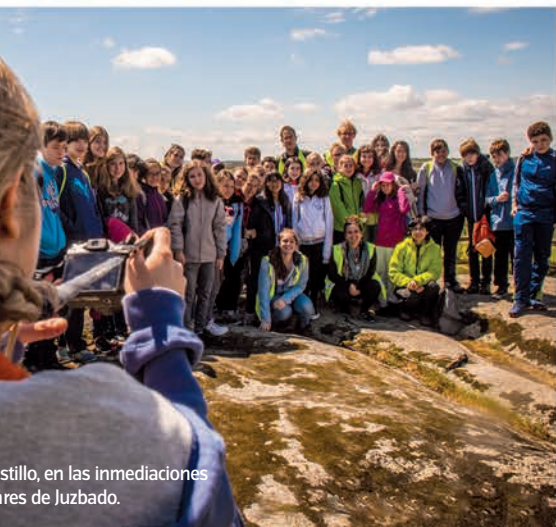
Castillo, en las inmediaciones de Juzbado.