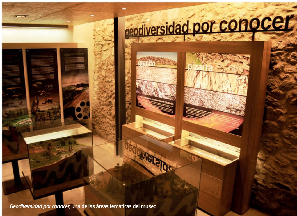
Geodiversidad por conocer, una de las áreas temáticas del museo.

Para el MAGRAMA el propósito de este proyecto cultural es contribuir al desarrollo del medio rural a través de espacios públicos y mediante la puesta en valor del territorio. Otra de las finalidades es abordar la divulgación sobre este aspecto del paisaje, ya que entre los ciudadanos existe un desconocimiento generalizado sobre la geología. Como complemento a la visita de la exposición los técnicos han preparado una serie de itinerarios de interpretación geológica por los alrededores de Juzbado para dar a conocer la geomorfología del paisaje y la riqueza geológica. R