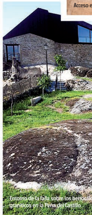
Entorno de la falla sobre los berrocales graníticos en la Peña del Castillo.