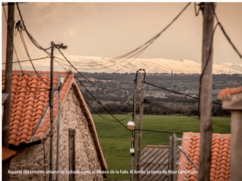
Aspecto del entorno urbano de Juzbado junto al Museo de la Falla. Al fondo, la sierra de Béjar-Candelario.