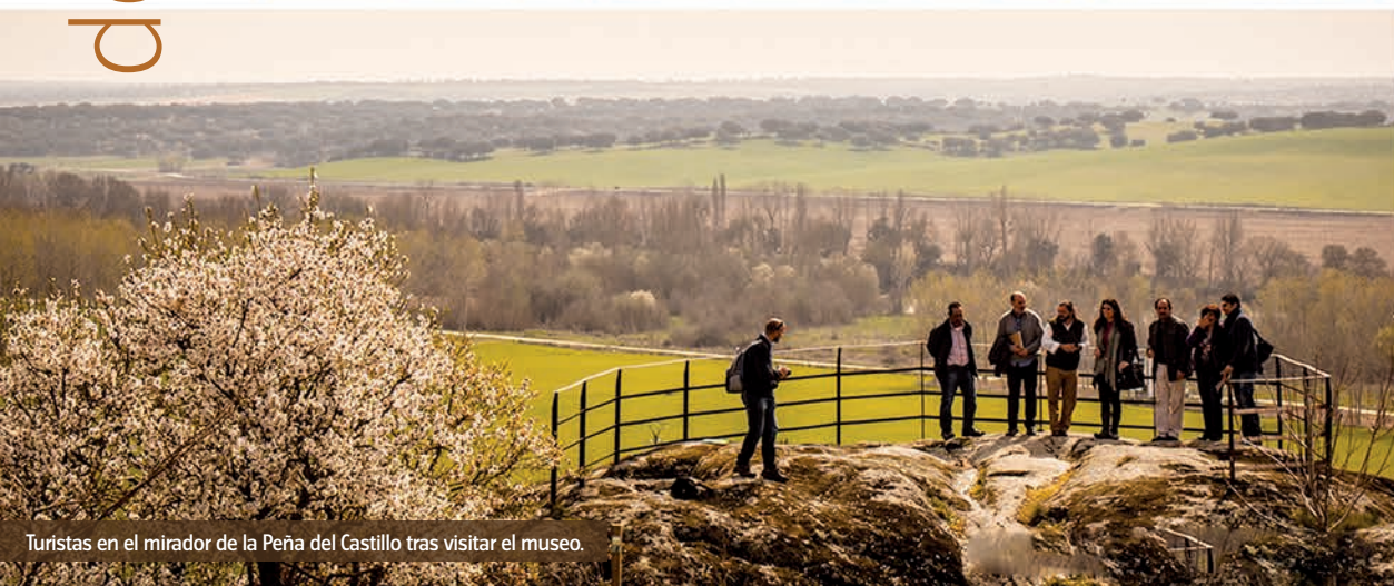
Turistas en el mirador de la Peña del Castillo tras visitar el museo.