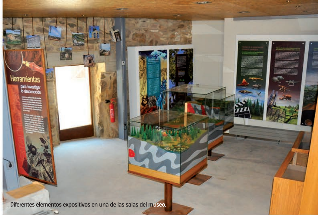
Diferentes elementos expositivos en una de las salas del museo.