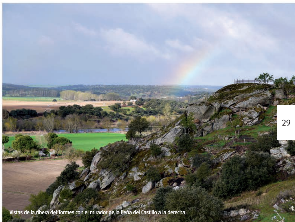
Vistas de la ribera del Tormes con el mirador de la Peña del Castillo a la derecha.