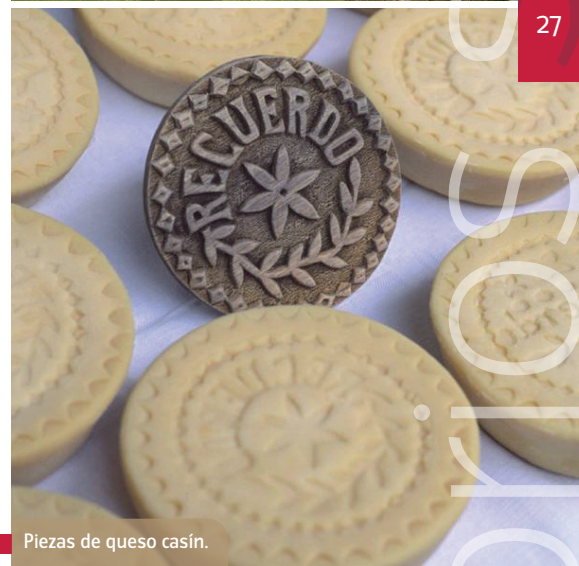
Piezas de queso casín.