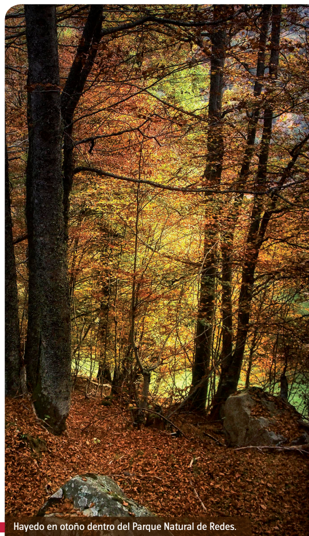
Hayedo en otoño dentro del Parque Natural de Redes.

Hayas, robles, castaños, abedules, arces, tejos, fresnos, avellanos, plárganos ... conforman los innumerables bosques de Redes, representando este conjunto más del 30% del territorio en los concejos de Caso y Sobrescobio.