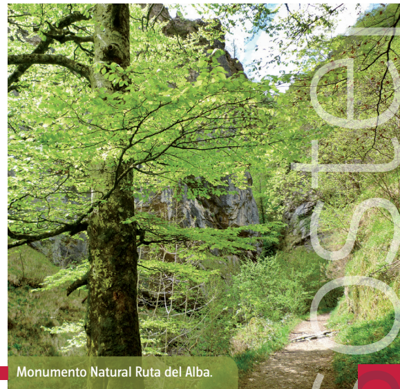
Monumento Natural Ruta del Alba.