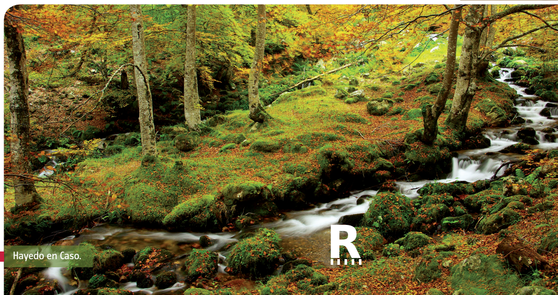
Hayedo en Caso.