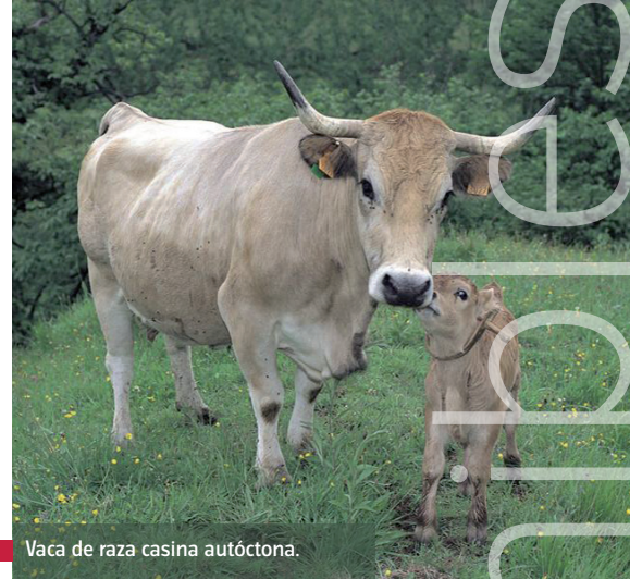
Vaca de raza casina autóctona.

Explotaciones ganaderas extensivas, sostenibles y, precisamente por ello, competitivas y con futuro. Muchas de ellas están bajo el sello de producción en ecológico, ofreciendo una carne de excelente calidad que arrastra tras de sí una marca y una identidad basadas en el buen manejo del territorio y en una raza autóctona adaptada a su medio natural, complementada con una alimentación sana y cuidada de los animales que garantiza su posicionamiento diferenciado en el mercado. El concejo de Sobrescobio es el que más extensión destina a prácticas ganaderas ecológicas en Asturias, con un 40% de la superficie agraria útil (SAU), siendo la media en Asturias del 5%. R