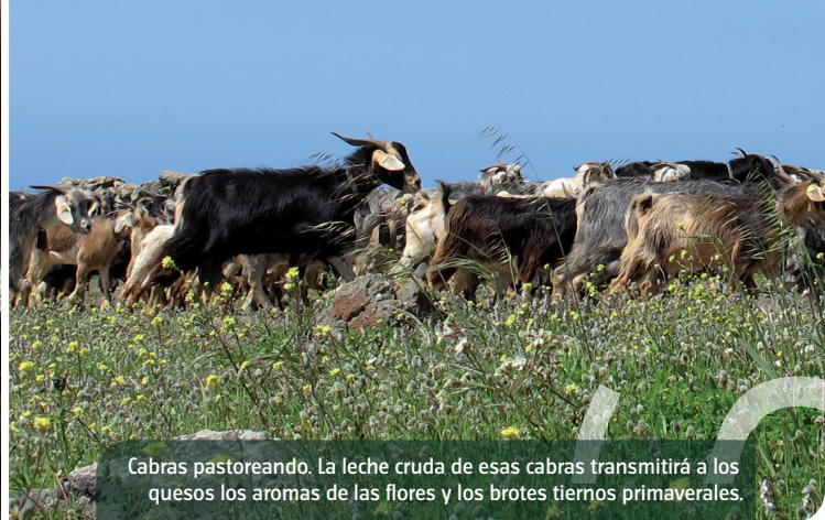
Cabras pastoreando. La leche cruda de esas cabras transmitirá a los quesos los aromas de las flores y los brotes tiernos primaverales.

establecimientos en la Unión Europea, pero no todos los Estados miembros están teniéndola en cuenta. Así lo manifestó Paolo Caricato, alto funcionario de la Dirección General de Sanidad y Consumidores de la CE en el Congreso Europeo sobre Seguridad Alimentaria en Pequeñas Queserías, que se celebró en Zafra (Badajoz) en mayo de 2012. También el Congreso de los Diputados, en el mes de mayo de 2013, ratificó por mayoría absoluta una proposición no de ley en la que se solicita la flexibilización de las normas que regulan las queserías artesanas.