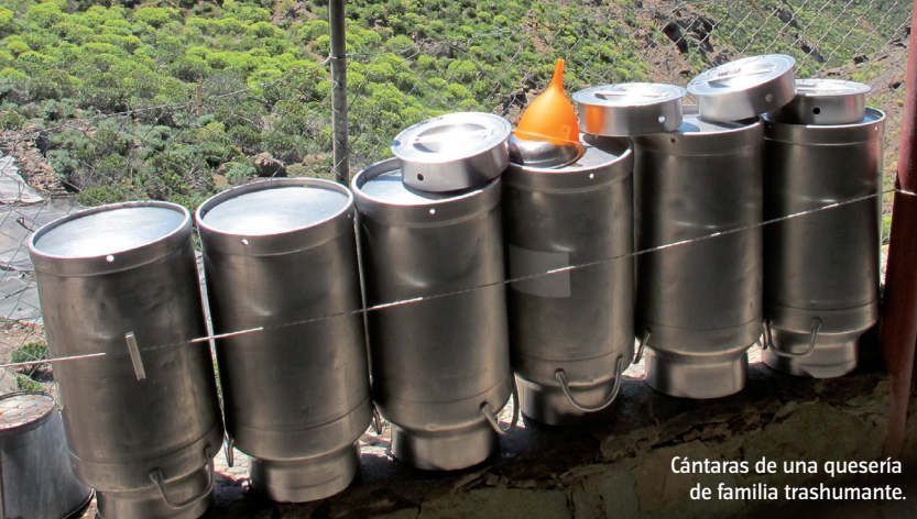
Cántaras de una quesería de familia trashumante.