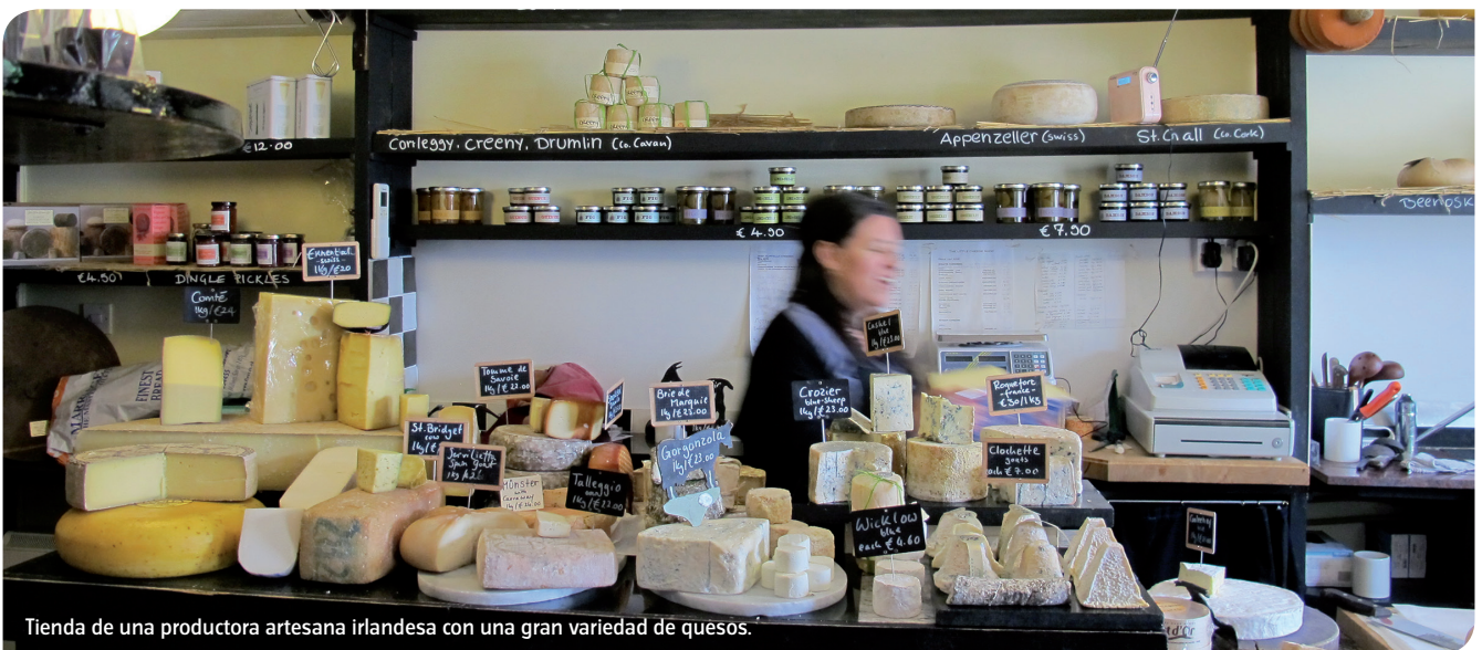
Tienda de una productora artesana irlandesa con una gran variedad de quesos.

La Red Española de Queserías de Campo y Artesanas es una asociación sin ánimo de lucro creada hace un año por los propios productores para la defensa y promoción de este tipo tan particular de queserías que se diferencian principalmente por el arraigo en el territorio, por el volumen de su producción y por la utilización de productos naturales. La asociación nace con una prioridad: disponer de interlocución para incluir los modelos artesanales en el diseño de las normas.