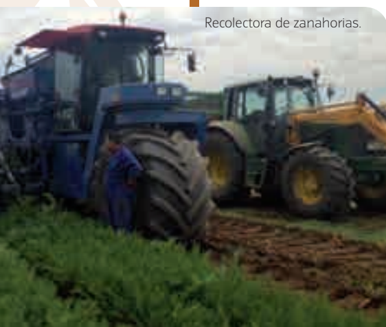
Recolectora de zanahorias.

Desde entonces representa y atiende las necesidades de las empresas y de los empresarios, agrupando a todos los sectores productivos, Aglutina, con carácter voluntario, a cerca de dos millones de empresas y autónomos de todos los tamaños a través de asociaciones de base que configuran una red de 240 organizaciones sectoriales y territoriales. Además promueve un entorno adecuado para favorecer la actividad empresarial, contribuyendo al crecimiento y bienestar de la sociedad española, tanto en el medio urbano como en el medio rural.