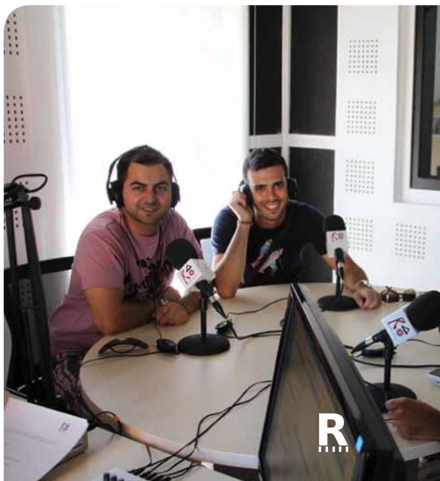
Colaboradores durante la emisión de un programa en el estudio de Radio Adaja, creada gracias al proyecto LEAL.

“Antes nadie venía a ver la iglesia del pueblo; ahora, gracias al proyecto LEAL, han acudido más de veinticinco autocares en la última temporada”.