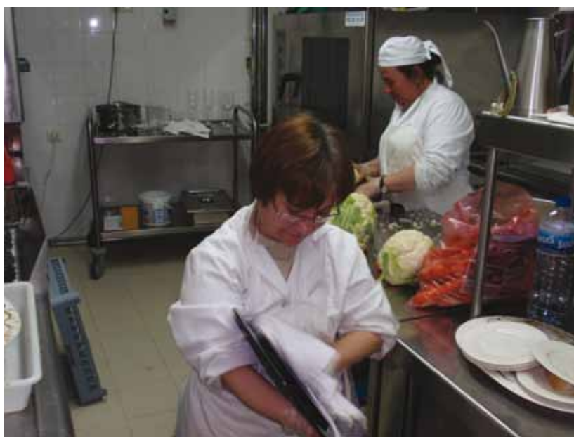
La integración de personas con discapacidad es un hecho en la cocina de la Posada Miranda, en Miranda del Castañar, Salamanca.