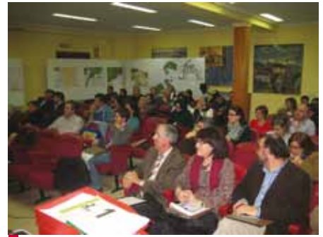
Reunión del II Foro de Acción Social en Salas de los Infantes (Burgos).

El trabajo del equipo de Círculos de Innovación sirve, entre otras cosas, para conocer las causas que debilitan el acceso al mercado de trabajo a esas personas: problemas de desplazamiento, escaso impacto de las medidas laborales de acción positiva en el medio rural, falta de asesoramiento y apoyo a iniciativas de auto-empleo, necesidad de un servicio