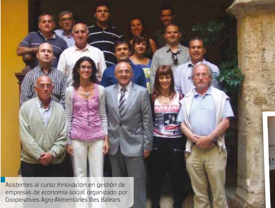
Asistentes al curso Innovación en gestión de empresas de economía social , organizado por Cooperatives Agro-Alimentàries Illes Balears.

Productos que se comercializan a través de las diferentes cooperativas que integran la asociación.