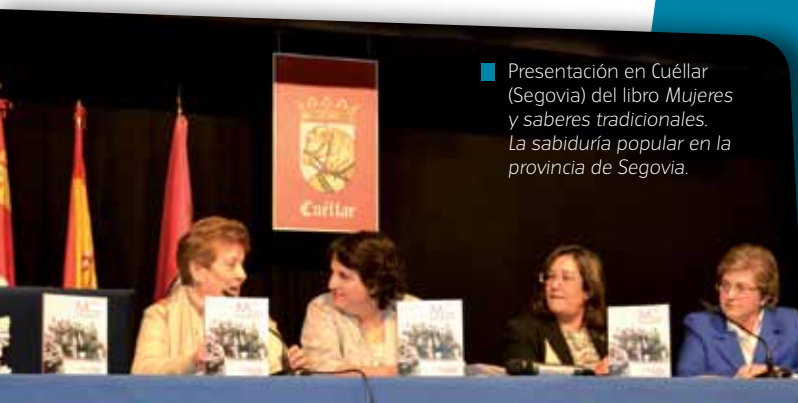
■ Presentación en Cuéllar (Segovia) del libro Mujeres y saberes tradicionales. La sabiduría popular en la provincia de Segovia .