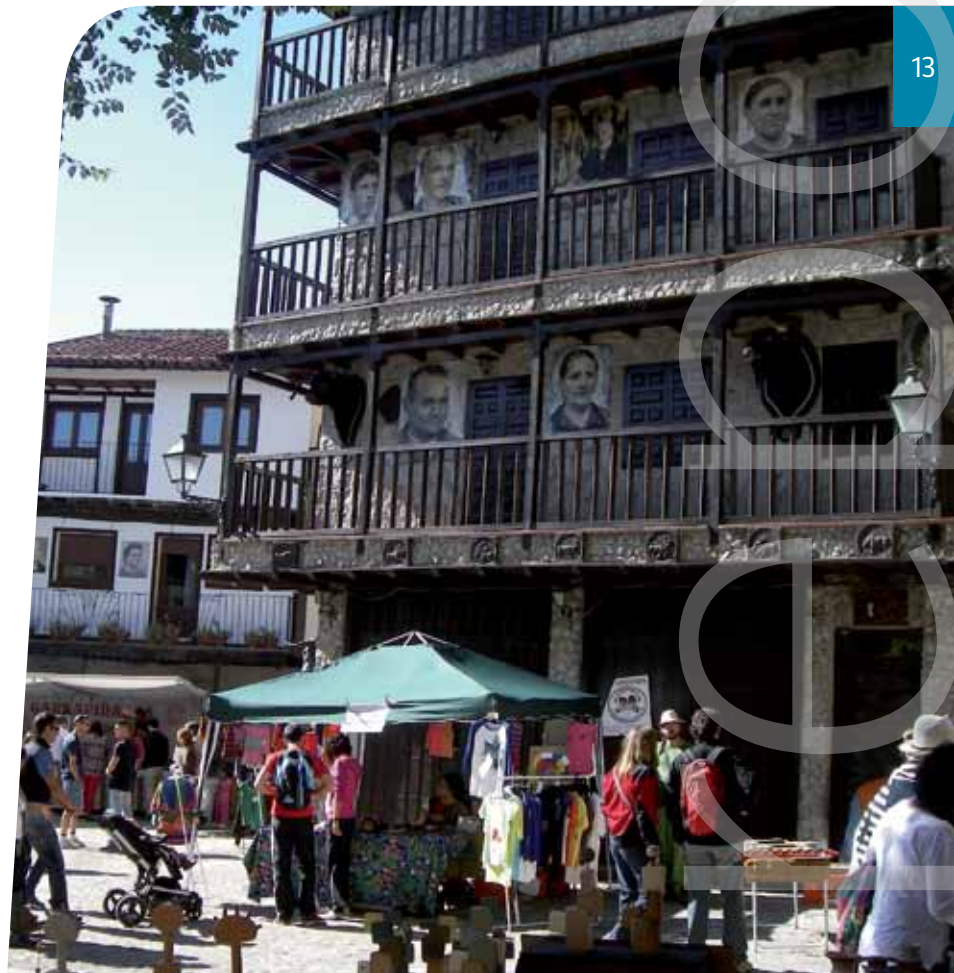
Congosto de Valdavia (Palencia), a la izquierda, y La Alberca (Salamanca), a la derecha, han acogido diferentes iniciativas asociadas a De mayor a menor , en las que se han compartido experiencias, saberes y productos.

Taller de poda e injerto, realización de mercados locales para la venta de productos locales, feria de repostería tradicional, creación de huertos escolares, talleres de fomento de la cultura emprendedora y la creatividad, recogida de patrimonio gráfico, recuperación de toponimia, red de cocineros, tertulias con historia, jornadas de recuperación y difusión de instrumentos musicales tradicionales, El Arca del Gusto (jornadas slow-food ), cursos de artesanía alimentaria, de etnobotánica, de técnicas y materiales de construcción tradicionales, de restauración de muebles... A veces, nada mejor que una simple enumeración para resumir lo que una iniciativa como la presente está consiguiendo en sus lugares de actuación.