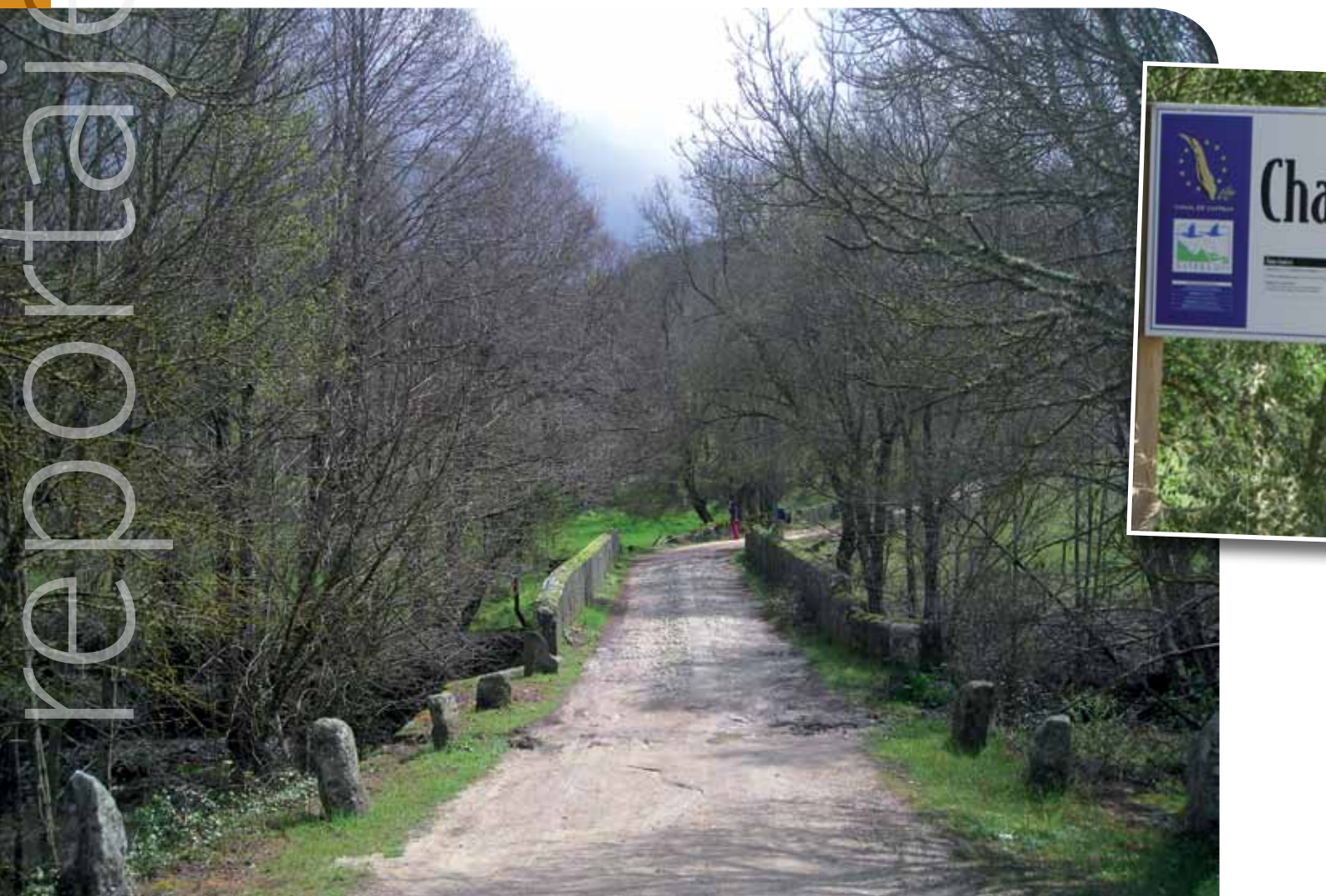
■ La calzada romana de la Vía de la Plata a su paso por la sierra de Béjar es protagonista de una de las rutas diseñadas por la Asociación Salmantina de Agricultura de Montaña.