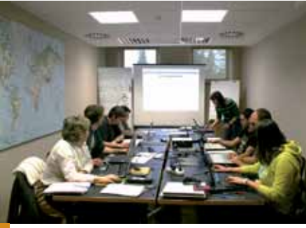
La formación de técnicos es uno de los aspectos clave que impulsa Cartorural.

realizar una búsqueda/selección de información en función de sus preferencias.