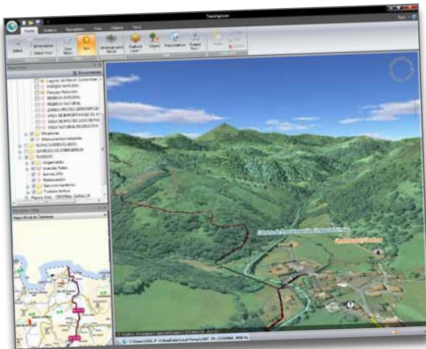
■ Captura de un vuelo virtual sobre una de las zonas integradas en Cartorural, la Montaña Navarra.

El Buscador de Recursos Turísticos es también una aplicación que, partiendo de la base cartográfica generada por el proyecto, la relaciona principalmente con el turismo y permite a los usuarios