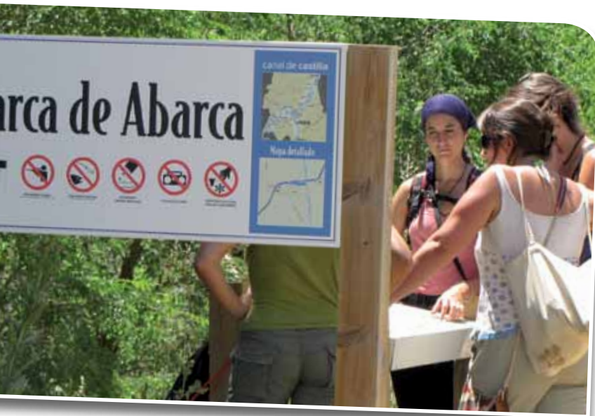
Los proyectos actuales que lleva a cabo la Fundación Global Nature aprovechan la infraestructura puesta en marcha ya por la entidad, como la señalización de rutas en torno a la Charca de Abarca, en Abarca de Campos (Palencia).

(funciona como albergue juvenil y sala de exposiciones y de reuniones) de Torrejón el Rubio; como otros en Tierra de Campos. La Casa Museo de la Laguna de Boada, junto al humedal de Boada