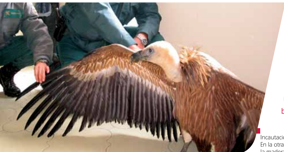
Incautación de un buitre leonado, especie protegida. En la otra página, el delito descubierto por el Seprona está en la madera de los marcos de esta colección de mariposas.