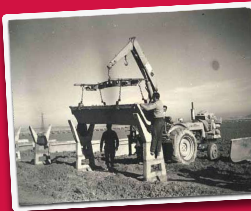
Obras de construcción de riego mediante acequias y montaje mecánico en La Nava (Palencia).

Como resultado, tenemos que actualmente en España entre el 50-60% de la producción final agraria se produce en tan solo un 16% de la superficie total cultivada, unos 3,4 millones de hectáreas, de los que cerca de un 50% utilizan riego por goteo y un 15% por aspersión. De esta manera se limita en gran medida la emisión de efluentes contaminantes y se facilita una mejor garantía de aplicación del agua en función de las cambiantes necesidades de las producciones que demandan los mercados.