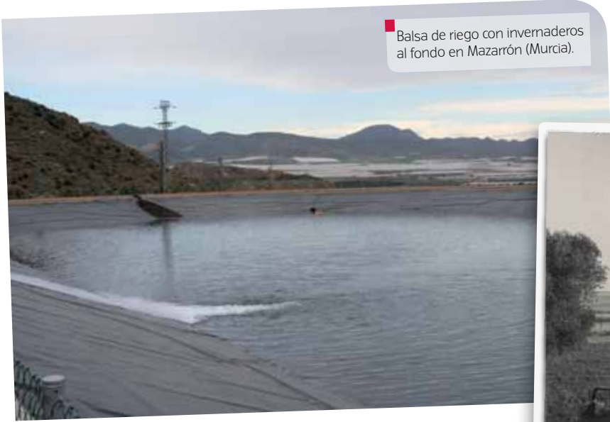
■ Balsa de riego con invernaderos al fondo en Mazarrón (Murcia).