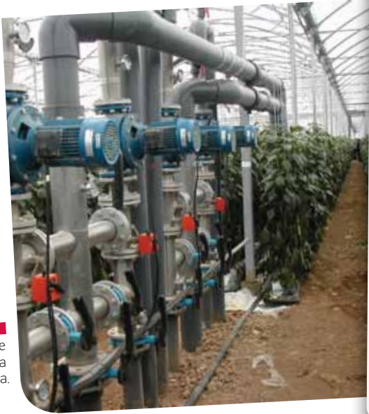
■ Invernaderos altamente tecnificados en la provincia de Almería.