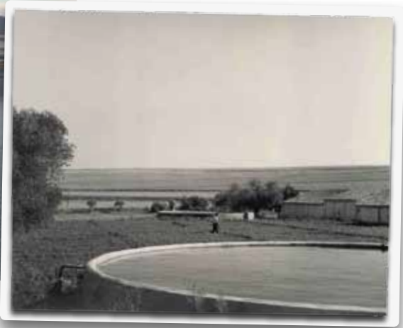
■ Antigua balsa de riego en Maqueda (Toledo).