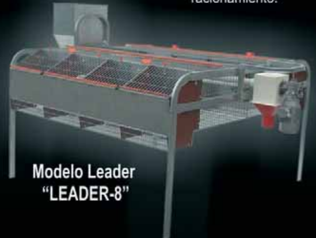
Modelo Leader "LEADER-8"