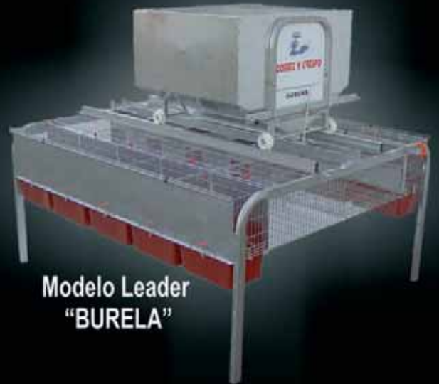
Modelo Leader "BURELA"