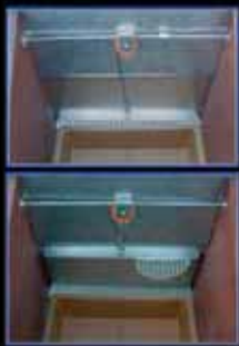
Control de lactancia automático