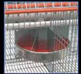
Comedero especial "Sinfin" Fácil racionamiento.