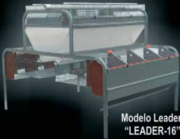
Modelo Leader "LEADER-16"

SERVICIO, INNOVACIÓN Y DISEÑO AL SERVICIO DEL CUNICULTOR