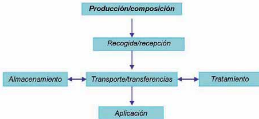
Figura 1.- Factores que intervienen en la gestión de los estiércoles

sentan una pequeña proporción en relación a las deyecciones.