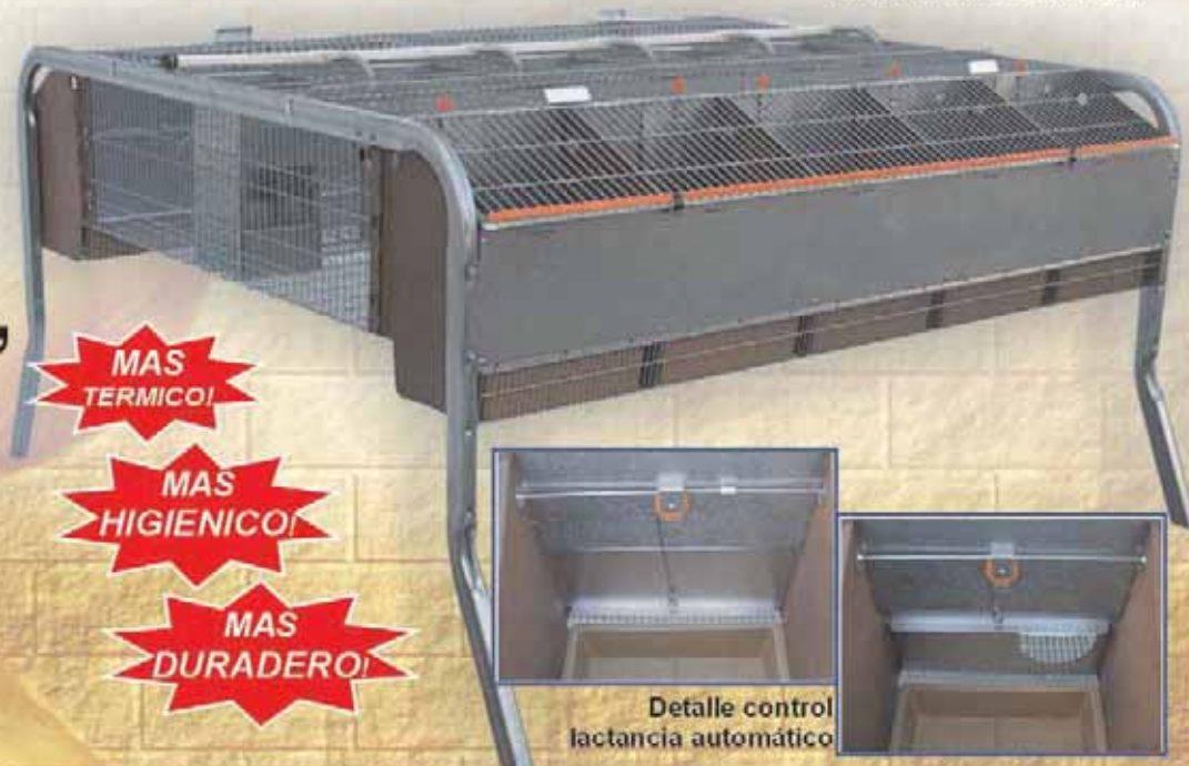
Detalle control lactancia automático

Piso de la jaula en dos niveles, uno jaula y otro mas bajo para nidos, con gran accesibilidad a la totalidad del hueco.