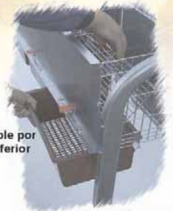
Nido extraíble por la parte inferior

"Práctica para la manipulación de los animales".