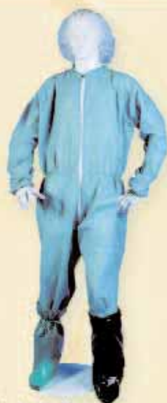
Vestuario desechable para entrada en granjas.