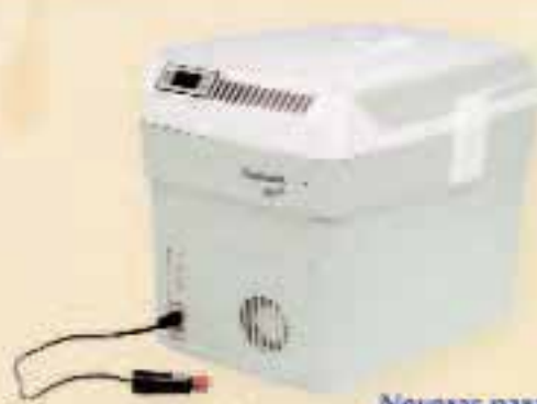
Neveras para transporte de semen y vacunas.