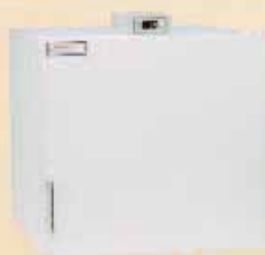
Neveras de conservación de semen de 70 litros.