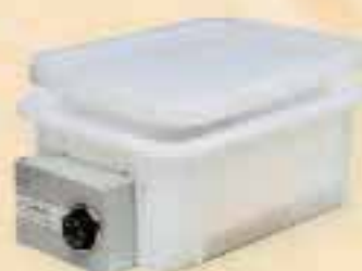
Baño María (Varios modelos y tamaños).