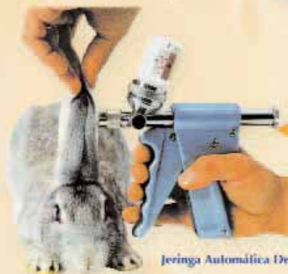
Jeringa Automática Dermojet.

EXTRACCIÓN DE JERINGAS FRASCO CON SIE ANEJO ORIGINAL