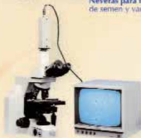
Microscopios (Varios modelos)