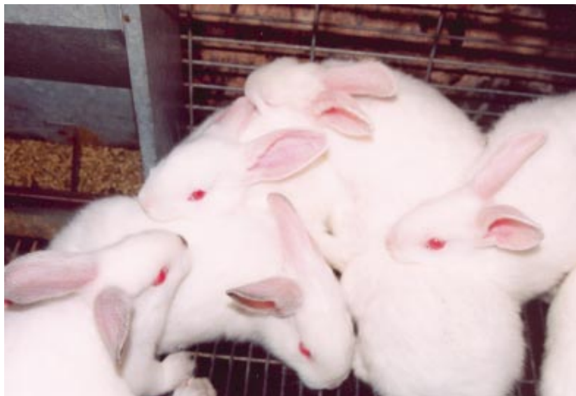
El uso cada vez más extendido en las granjas españolas de conejas cruzadas seleccionadas por prolificidad se traduce en un aumento anual de 0'1 gazapo nacido por parto

A la vista de los resultados parece que la cunicultura Española se halla en un momento de transición, a la expectativa de cómo evolucionan los problemas que afectan al sector, principalmente la enteropatía mucoide.