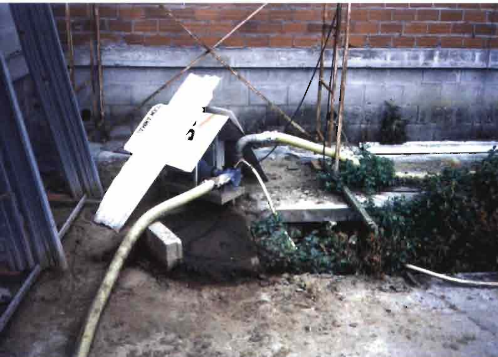
Detalle de la bomba que succiona las deyecciones.

cha las mismas letras. Siguiendo esta premisa y pasados 15 años, se mantiene una población autóctona en la que muchos animales tienen en su registro 3 letras o más. Con este sistema de cruzamientos se ha conseguido una población mejorada zootécnicamente gracias a la heterosis y a la complementariedad cuyos resultados productivos son francamente interesantes: