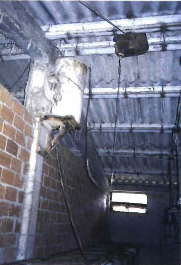
Ingenioso invento para dosificar las medicaciones en el agua mediante goteo.