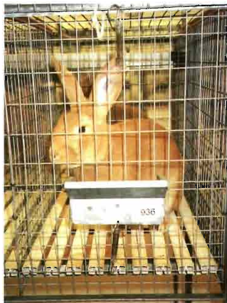
Raza leonado de Borgoña.