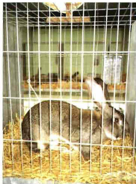
Raza gigante liebre.

PROMCONIT - Viale Panzacchi, 25 - Bologna. Tel. 051 583131