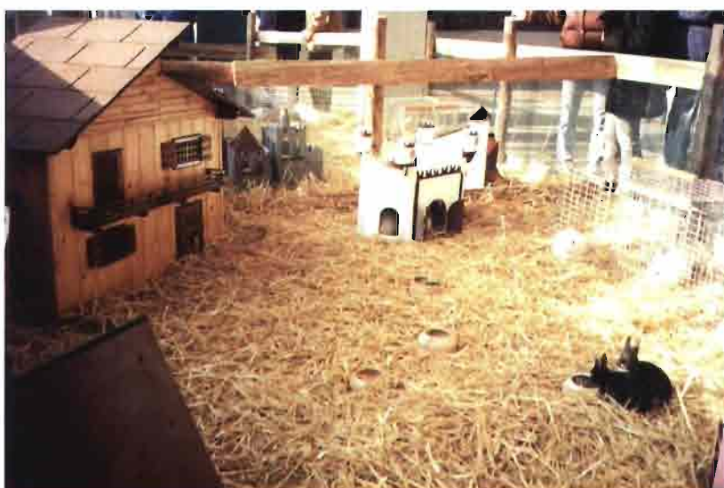
La presentación de conejos enanos en un ambiente "discutible" y que incentiva al conejo como animal de compañía.