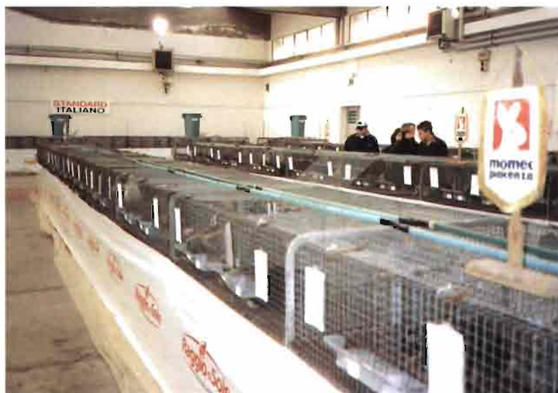
A los campeones de raza se les coloca un banderín en la jaula.