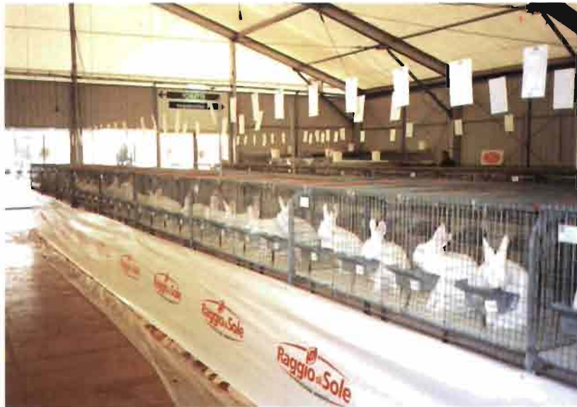
La raza NZB junto a la CAL las más abundantes con 154 y 244 animales respectivamente.

ENTRADA GRATUITA PARA QUIEN COMPRE CARNE DE CONEJO. Una singular iniciativa que intenta promocionar la gus-