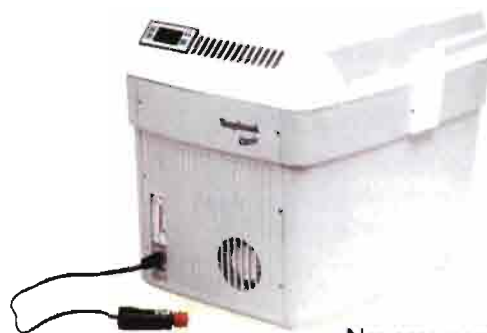
Neveras para transporte de semen y vacunas.