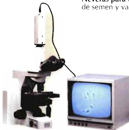
Microscopios (Varios modelos).