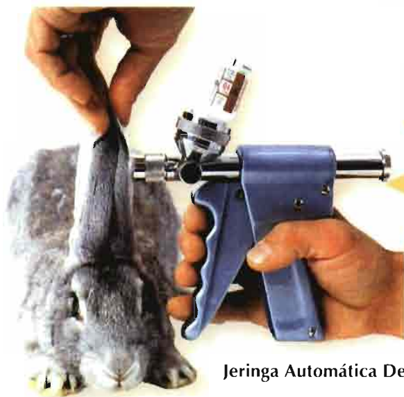
Jeringa Automática Dermojet.

REPARACIÓN DE JERINGAS DERMOJET, CON RECAMBIOS ORIGINALES.