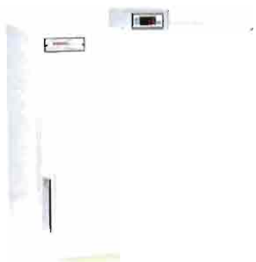
Neveras de conservación de semen de 70 litros.