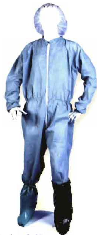
Vestuario desechable para entrada en granjas.