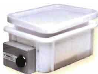
Baño María (Varios modelos y tamaños).