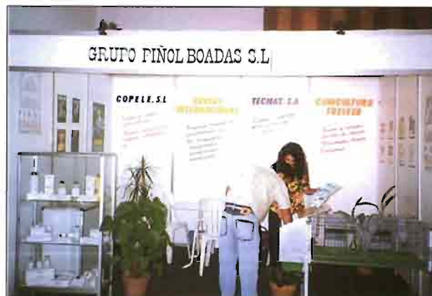
Stand del Grupo español "Piñol Boadas, S.L."