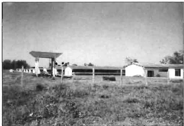
Visita general de las naves.