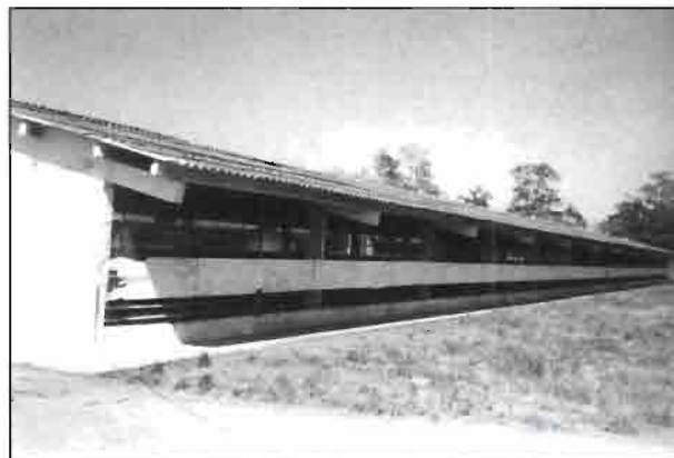
Detalle de una nave.