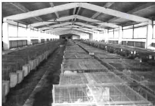
Interior de una de las 12 naves.