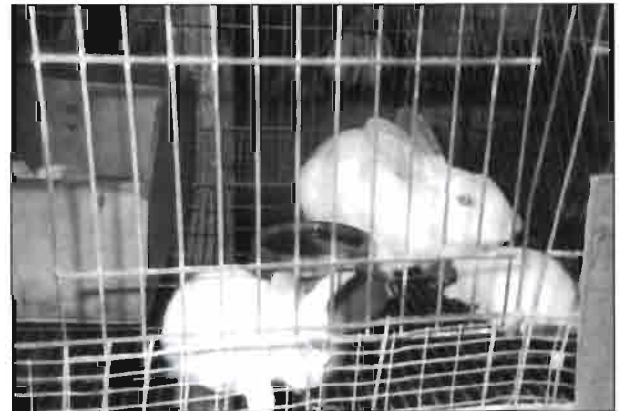
Predominan los animales cruzados de capa blanca.