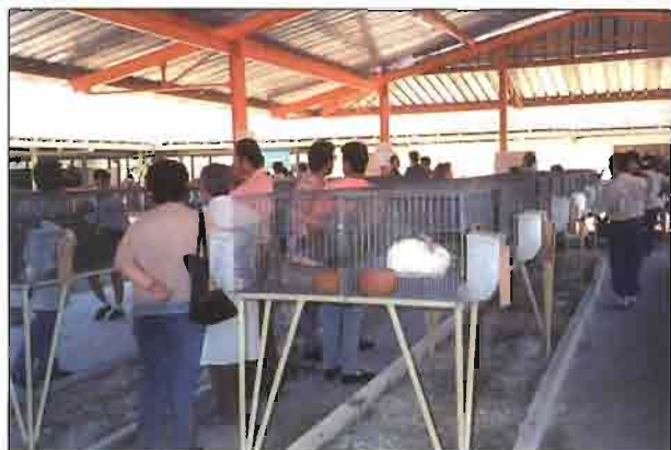
Exposición de conejos en la Feria Agropecuaria.

Durante los días 17 al 25 de Febrero se celebró en La Habana la Feria Internacional Agropecuaria Ha-