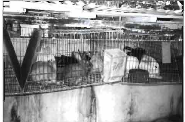
Detalle de jaulas con gran rastrillo para verde.