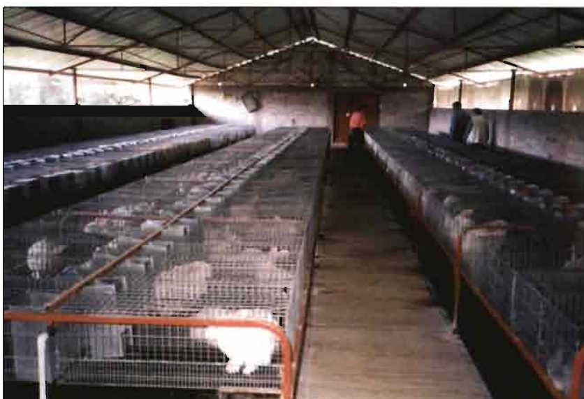
Vista interior de la primera nave que ha entrado en producción.