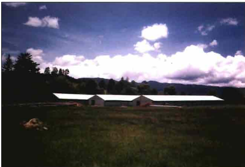
Instalación de las 3 naves del Centro de desarrollo Cunicola «El Escorial», una de las cuales está en funcionamiento. El proyecto prevé 1.200 madres en producción.