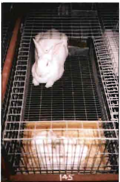
Detalle de una de las conejas de la granja, con sus crías.