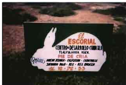
Un cartel anuncia la actividad cunicola y la diversidad de razas que se crían en la granja «El Escorial».

c) Edición de un recetario a todo color, que reparte en los puntos de venta, orientado a promocionar el consumo de carne de conejo.