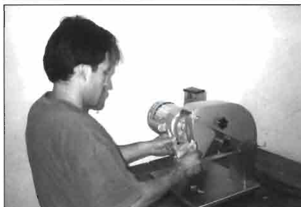
Detalle del troceado manual de las canales de conejo para la preparación de bandejas destinadas al mercado detallista y restaurantes.