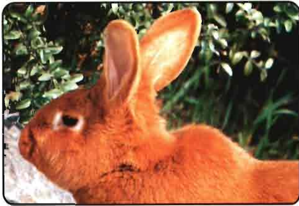
LEONADO DE BORGOÑA (Fauve de Bourgogne)