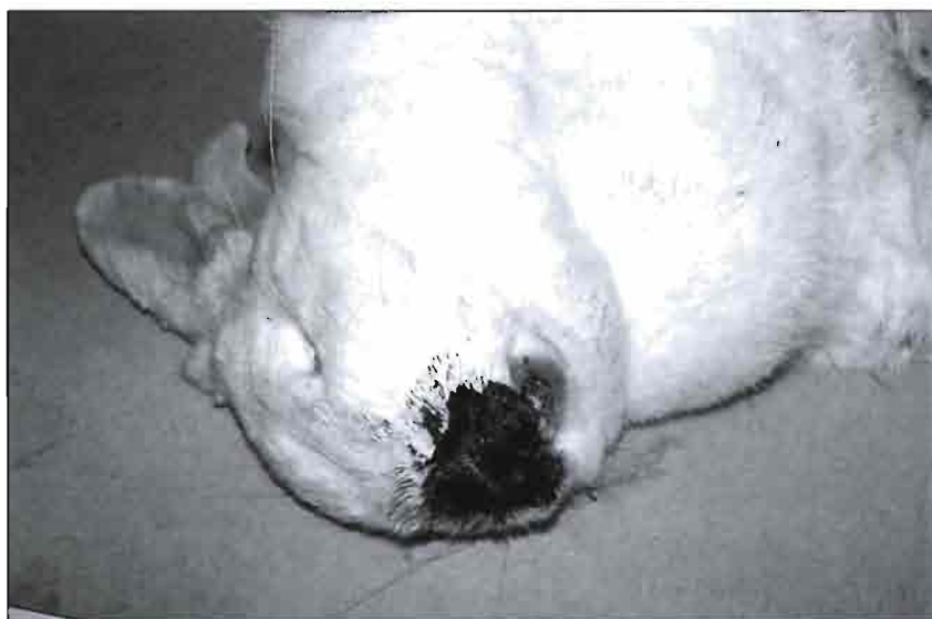
Imagen característica de un conejo muerto de un cuadro agudo de Enfermedad Virica Hemorrágica mostrando el fenómeno de epistaxis y emisión de sangre espumosa a través de las fosas nasales.

La EVH irrumpió en la población cunícola con la fuerza de una gran epizootia, causando graves pérdidas económicas en la industria del sector, devastando las explotaciones por la que pasaba. Esta situación hacía completamente necesario el desarrollo de medidas eficaces de lucha, control y erradicación, bien entendido que la erradicación sólo podía conseguirse a nivel de explotaciones individuales, ya que la EVH se halla difundida en el medio salvaje de modo que si no es posible controlarla en este medio, tampoco será posible erradicarla completamente en el medio doméstico e industrial.