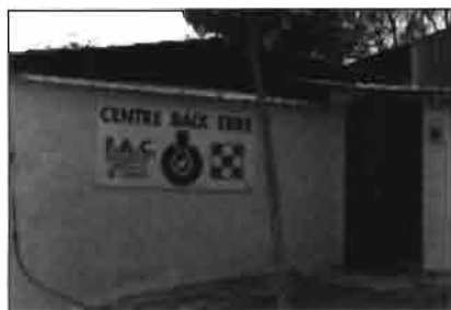
Vista exterior del Centro de I.A., que actualmente dispone de 200 machos.