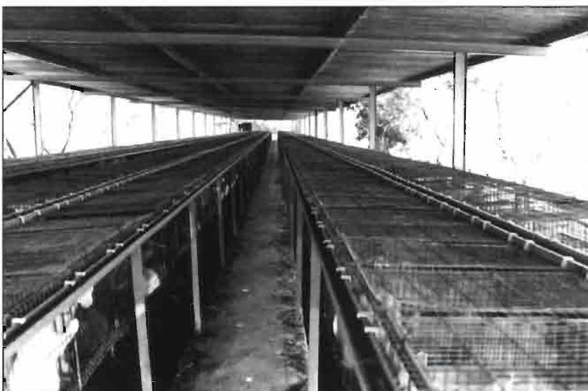
Engorde al aire libre de la nave anterior, con sistema flat-deck y distribución automática de pienso.