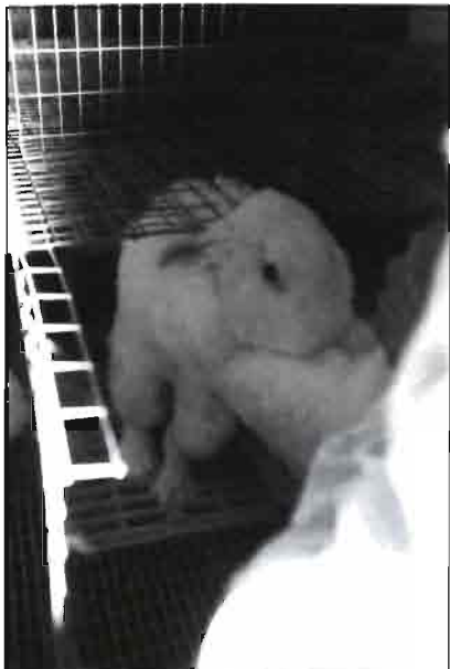
Instantánea en la recogida de semen, utilizando una hembra como estímulo.

to habitualmente trabajan dos personas en la instalación, personal que aumenta de forma eventual cuando hay que realizar determinadas operaciones puntuales ciertos días como son inseminar, poner nidos, repasar camadas, destetar, etc.