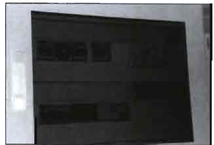
Panel de control de la temperatura en la sala de machos, constantemente en penumbra.

La máxima producción actual es de 2.000 dosis semanales, con