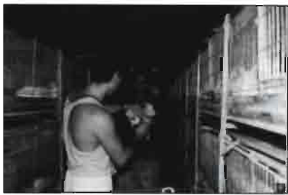
Momento de realizar la I.A. en la granja. El semen es suministrado por el Centro IN.RA. SAT situado a pocos centenares de metros de esta granja.