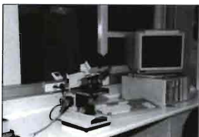
Detalle del laboratorio de preparación y control del semen.

El centro de I.A. que pudimos ver, será ampliado según un proyecto existente hasta 1.000 ma-