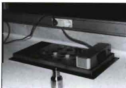
Baño maria a 27º constantes para adecuación y dilución del semen.

La doble extracción de semen se realiza una vez por semana, realizándose un control rutinario del que se exige una máxima calidad - concentración, motilidad, higiene, etc. - Para la monta se utilizan hembras para estimular a los machos, usándose una vagina artificial con alta temperatura > de 60º C, que produce un eyaculado rápido y eficaz.