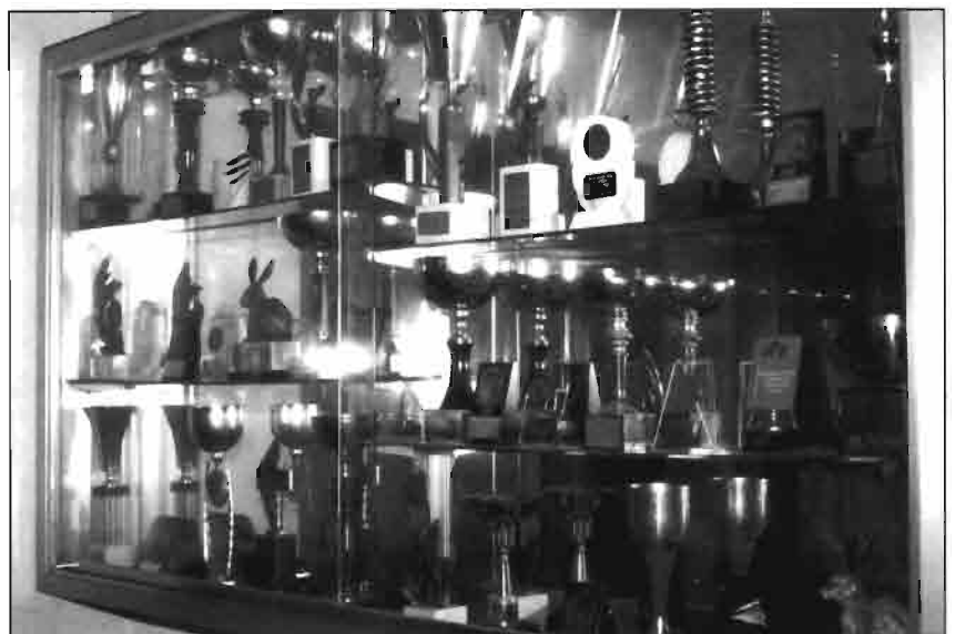
Después de años de dedicación y selección, la granja Riudemeia posee numerosos premios y distinciones procedentes de concursos en los que ha participado.