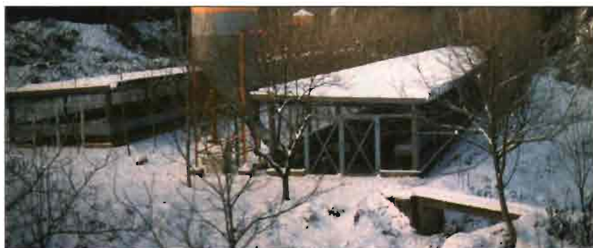
El conejar al aire libre soporta temperaturas frías en invierno y en ocasiones la nieve hace acto de presencia.

La granja dispone de dos naves al aire libre, una destinada íntegramente a la reproducción y otra a engorde. Ambas