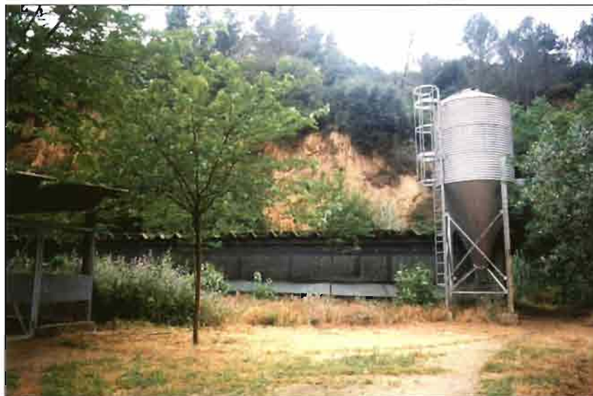
Vista exterior de una de las naves situada en medio del bosque y bien protegida de las inclemencias del tiempo.