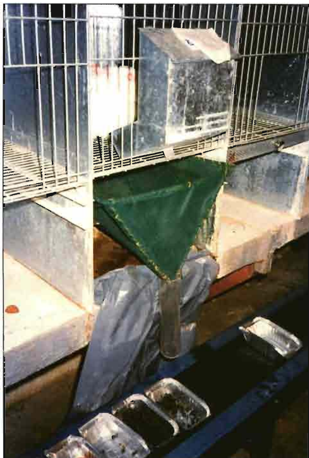
Jaulas metabólicas preparadas para recoger las deyecciones en diversas horas del día y de la noche.