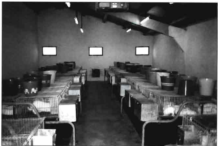
Detalle de una de las unidades experimentales de nutrología de los conejos, en un estabulario de ambiente controlado.

Otra nave, también de ambiente controlado, alberga unas 72 hembras con 8 machos y su engorde correspondiente, de donde se nutre