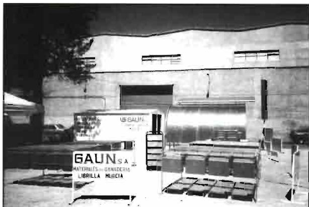
Exposición de material de GAUN, S.A.