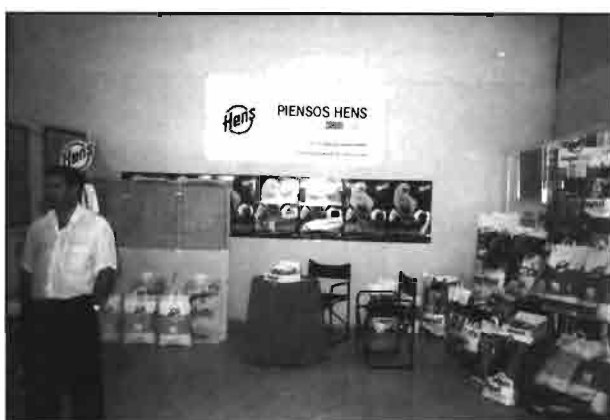
Productos para cunicultura y piensos de HENS, S.A.