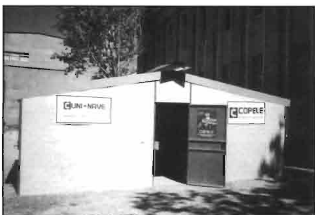
Montaje modular CUNINAVE expuestos por COPELE.