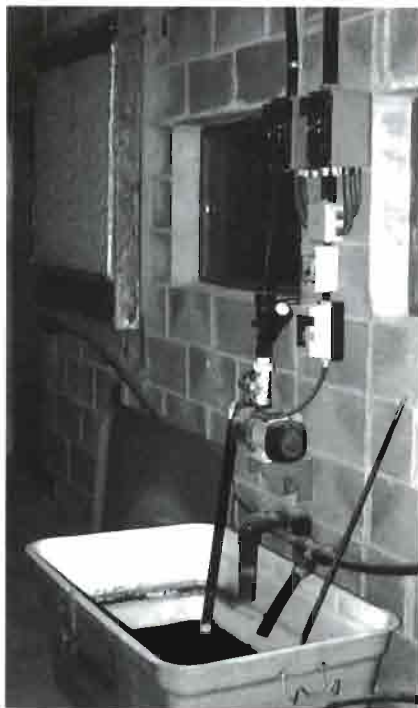
Detalle de la instalación del panel refrigerador, con la bomba de circulación del aire y depósito de recuperación. Este sistema se ha mostrado excepcionalmente eficaz en una zona de altas temperaturas estivales.

El edificio para garantizar un ambiente agradable cuenta con aislamientos muy eficientes. La construcción a base de bloques de hormigón viene a contribuir a la climatización interior, elemento clave en un conejar de ambiente controlado.