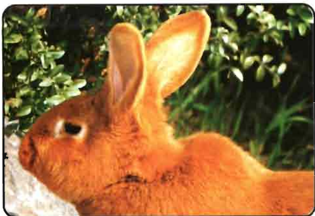
LEONADO DE BORGONA (Fauve de Bourgogne)