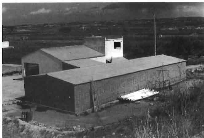
Aspecto exterior de la granja, carente de aberturas naturales o ventanas. El ambiente interno es totalmente controlado.

MONTAJE, EQUIPO, GENÉTICA Y NUTRICIÓN: Las refrigeración evaporativa del conejar fué instalada por SERTIC, las jaulas son de IMASA, los reproductores de IRTA y el pienso es de la COOPERATIVA AGROPECUARIA DE GUISSONA.