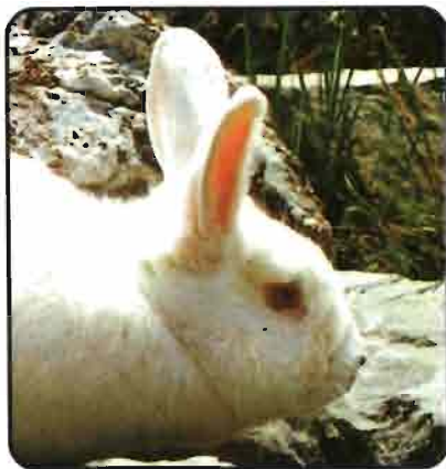
NEO ZELANDES (New Zeland)