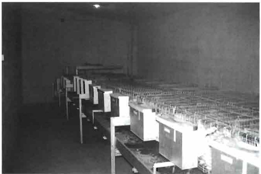
Aspecto de una de las salas de engorde con comedero exterior.

Los paneles de refrigeración evaporativa y unos adecuados aislamientos, producen una temperatura interna de 26° C., cuando exteriormente el termómetro marca en plena canícula más de 40° C. (Les Garrigues, Lleida).