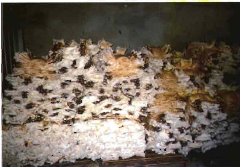
Pacas de pieles de conejo después del desecado y selección.