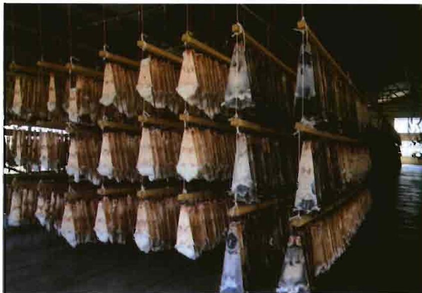
Dentro del aprovechamiento integral del conejo, se realiza el desecado de pieles. En el secadero que se muestra había más de 100.000 unidades en proceso.

Nuestro matadero paga por lo general el conejo de acuerdo con la lonja de Bellpuig, exigimos calidad y pagamos exactamente a los 15 días de haber retirado el ganado. En este aspecto procuramos actuar con la máxima seriedad, pues ha sido norma durante los 24 años en que estamos