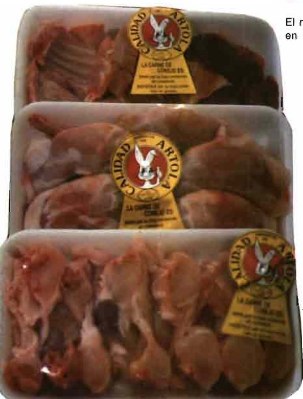
Modelos de presentaciones de conejo por piezas, tal como se pueden hallar en supermercados y detallistas.

funcionando. Podemos preciarnos de no haber devuelto nunca ningún talón, y los cunicultores lo saben. La línea de conducta es bien conocida, fuera de «aventuras» de las que lamentablemente han sido víctimas, y no hace mucho, no pocos cunicultores de la región. Por lo que respecta al futuro de la cunicultura creo que soy optimista. El mercado que atendemos va a más, y la carne de conejo entra dentro de los planteamientos de la dietética moderna. Creo que la carne de conejo va ganando prestigio lenta y progresivamente.