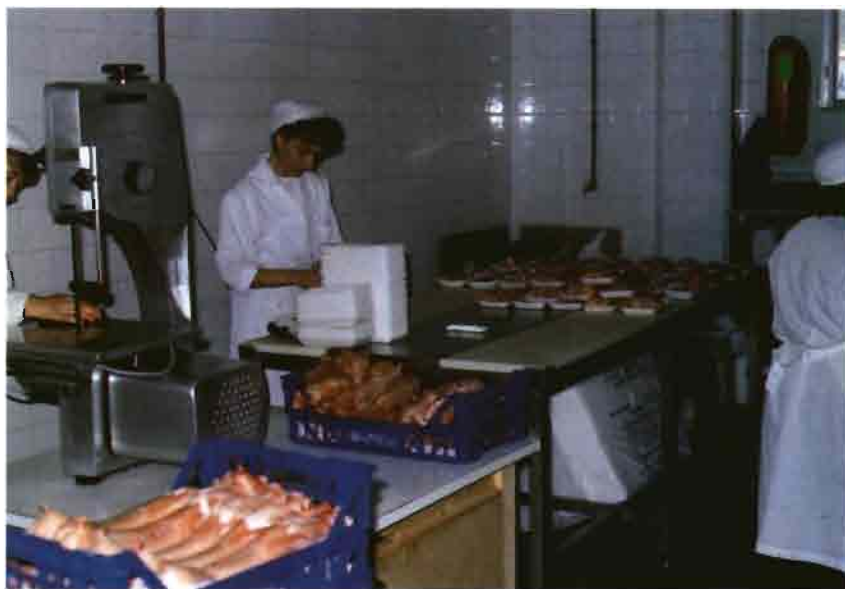
El matadero no sólo presenta canales enteras, sino que bajo pedido prepara bandejas en una sala de despiece amplia y bien acondicionada.