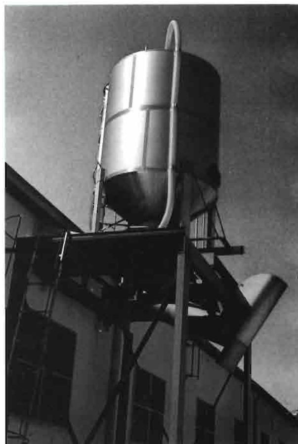
El gran volumen de vísceras dificulta su manejo y destrucción. El depósito que se observa en esta foto recoge los desechos, que son vertidos directamente en un vehículo adecuado, sin intervención de mano de obra.