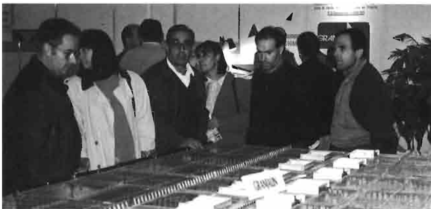
La exposición de conejos estuvo constantemente visitada y animada.

En el stand de la Asociación Española de Cunicultura, se presentó de forma destacada la «nueva revista», que como la mayor parte del sector ya sabe, se renovó hace un año. Las publicaciones cuniculas estaban faltadas de un órgano de difusión que compaginase la amenidad, con la información de primera mano, sin descuidar la técnica y los reportajes. Los lectores son cautos... y después de un año de «prueba» podemos decir que la revista está cada vez más consolidada. Fueron muchos los cunicultores que conocieron por primera