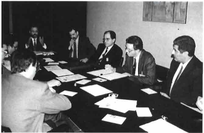
Reunión internacional de técnicos y Asociaciones Europeas de Cunicultores en EXPOAVIGA.

En el palacio n.º 2 —del Cincuentenario—, se concentró parte