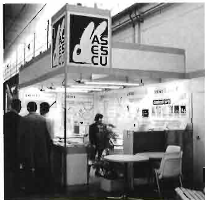
ASESCU lideró la cunicultura en la sección dedicada a esta especie, promocionando sus actividades.

CUNICULTURA FREIXER. Presentó dentro de su línea habitual, animales de diversas razas y