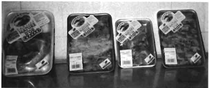
Una de las iniciativas más prometedoras es la venta de conejo troceado, que está encontrando un amplio eco y aceptación entre los consumidores.

Como afinamos el pago de conejos por rendimientos, nuestras granjas suministradoras ven compensada la calidad. Los rendimien-