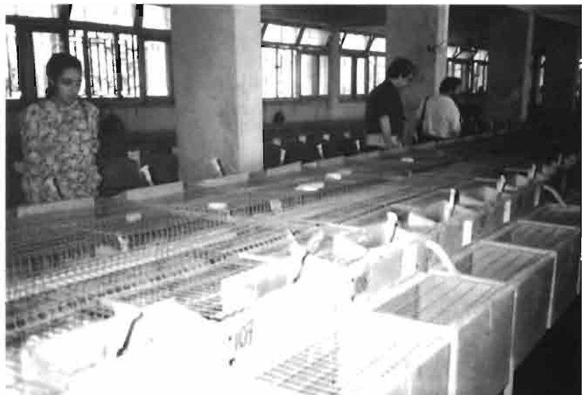
Vista interior de una nave en la Universidad de Zagazig