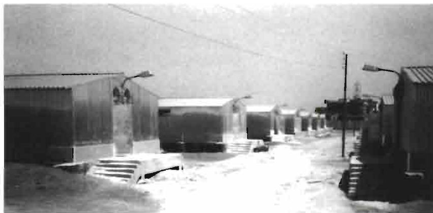
Vista exterior de las naves construidas en cooperación con Hungría

calcula que los efectivos en producción sobrepasa el millón de hembras reproductoras. La producción se sustenta en dos tipos de explotaciones: Las granjas tradicionales con 5 o 10 hembras que es una actividad familiar, pero sobretodo una actividad femenina que destina la producción al autoconsumo. Este tipo de explotación se encuentra en todo el país. Las granjas de tipo nacional aparecen después del año 1985 en que se pone en marcha un plan para mejorar el nivel de proteína animal consumida por la población; para ello, se crearon unos centros pilotos para producir reproductores, difundir razas y mejorar técnicas de granja.