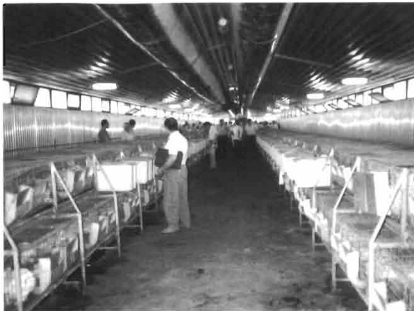
Interior nave con material importado de Hungría. Bateria de dos pisos: arriba las hembras y debajo el engorde

puede mencionar que las naves y los equipos son modernos pero que un clima tan caluroso como el de Egipto, requiere un manejo perfecto de las condiciones de ambiente para no limitar la producción. Por otro lado hay que readaptar todo el manejo de los reproductores para adaptarlos a unas condiciones climáticas y sociales diferentes de los países donde se ha estudiado estas pautas. Finalmente mencionar que no se ha visto cunicultura tradicional donde se empleen líneas de conejos autóctonas. (O. RAFEL) ■