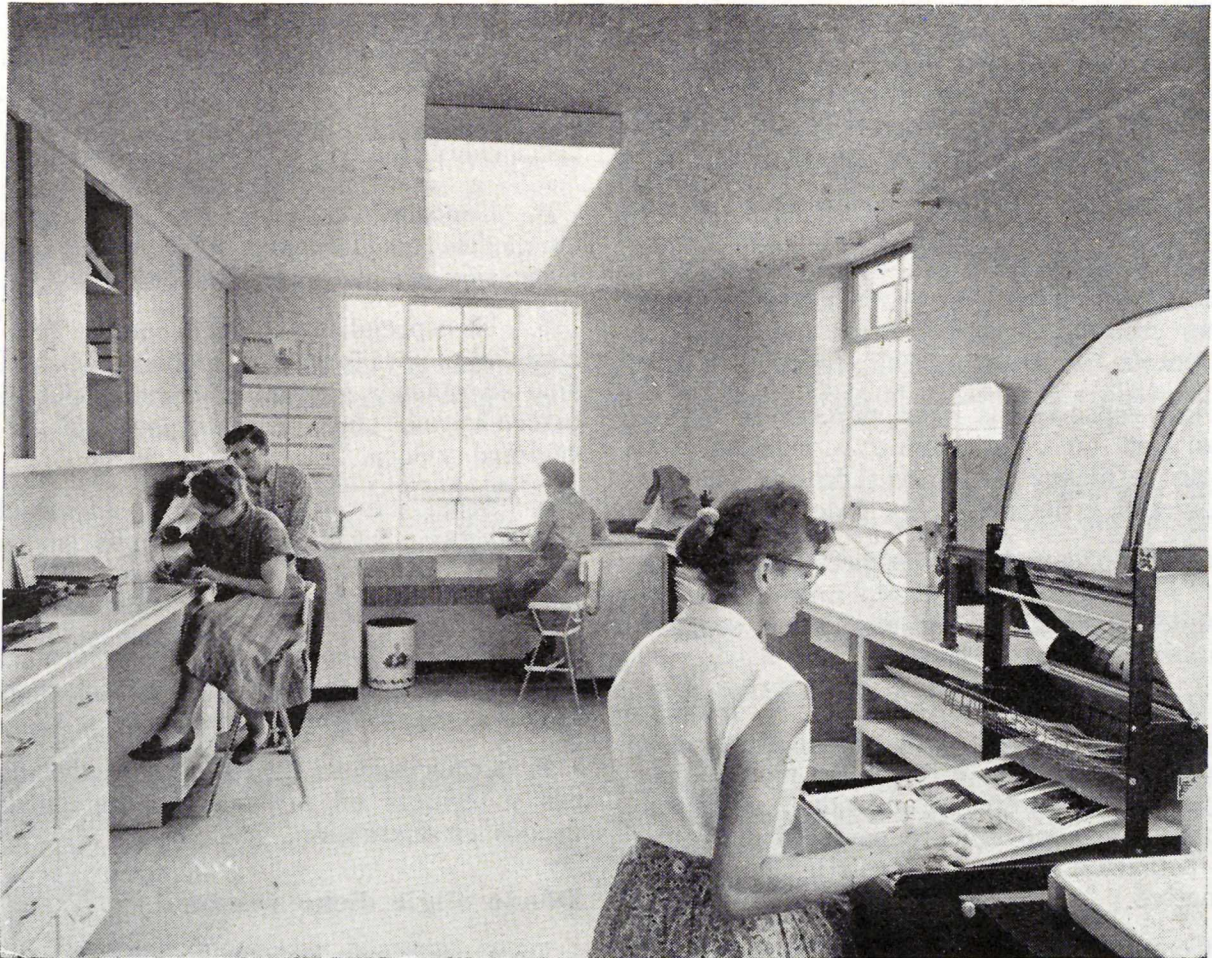
Laboratorio fotográfico de un Servicio de Información,

Para programas de radio, la grabación de cintas magnetofónicas con asuntos de actualidad o interviús con ciertos especialistas o personas interesantes en el ámbito de la agricultura, proporcionará un buen material para los programas llevados a cabo por las Agencias.