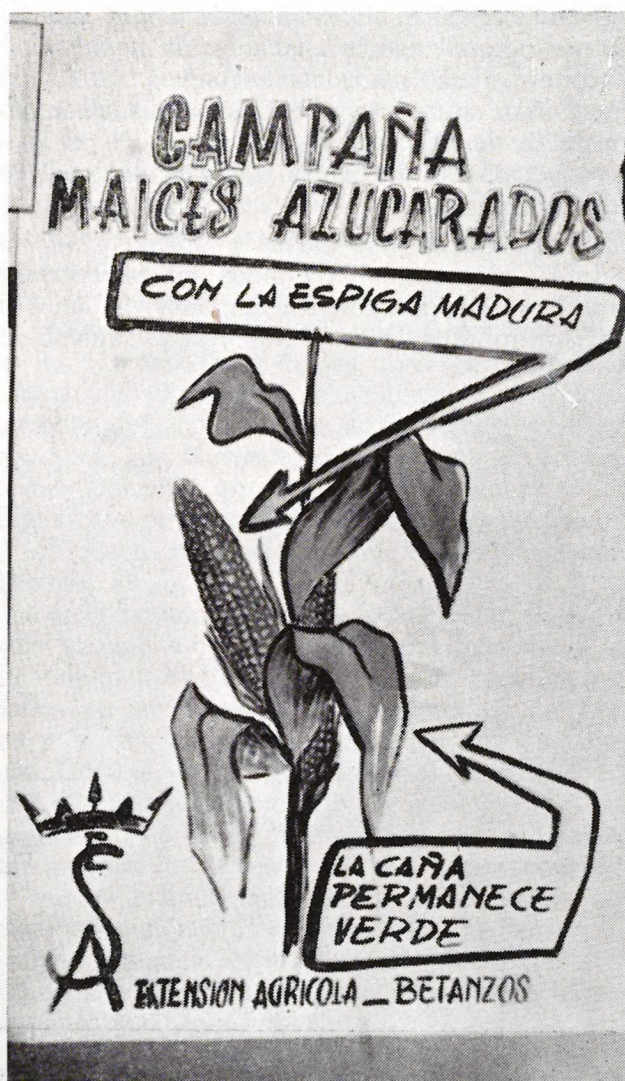
Carteles murales anunciadores del Servicio de Extensión Agrícola de Betanzos.

jeto de la campaña, a las que se les expone un anteproyecto y, con su colaboración, se redacta el definitivo. Se confeccionan carteles murales, hojas divulgadoras, circulares, etc., y cuanto